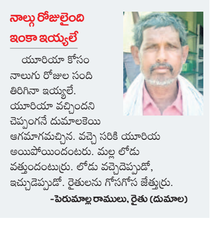
యూరియా కోసం తిప్పలు