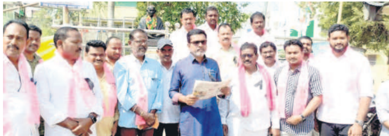
మంధని పట్టణంలోని గాంధీవోకల్లో మాట్లాడుతున్న పుట్ట మధూకర్