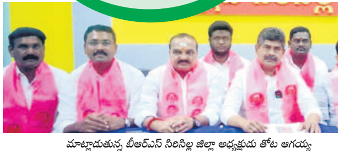
మాట్లాడుతున్న బీఆర్ఎస్ సినిస్ట్ర జిల్లా అధ్యక్షుడు తోట ఆగయ్య