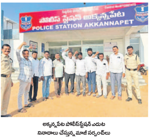
అక్కన్నపేట పోలీస్ స్టేషన్ ఎదుట నిరాదాలు చేస్తున్న మాజీ సర్పంచ్లు

Required Qualified and Well Experienced Teachers to Teach in a Reputed School at ZAHEERABAD For Primary and High school Level to Teach All Subjects and Also Computer Operators Salary Structure: Primary: 15000 & Above, And H. School : 25000 & Above For Details Contact 72072 08292