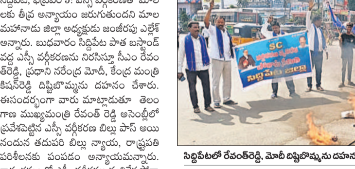
నిర్దిష్టలో రేపంకేరెడ్డి, మోటి దిప్పిపోయిన దహనం చేస్తున్న మాల మహానాడు నాయకులు