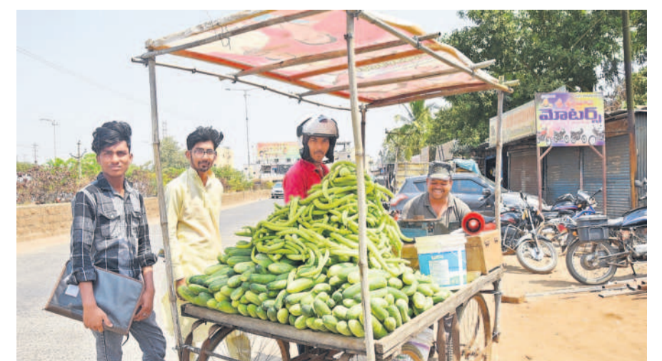
మార్చి, ఏప్రిల్, మే లో అందలు అక్కువగా ఉండే అవకాశం

ఈ ఏడాది మార్చి, ఏప్రిల్, మే నెలల్లో పాటు రోహిణి కాల్చి అందలు తీవ్రంగా ఉండే అవకాశం కనిపిస్తున్నది. ఇప్పటివరకు ఉన్న వాతావరణం వేరు, రానున్న కాలంలో పరిస్థితులు వేరుగా ఉండవచ్చు. రాత్రిపూట చలి, మధ్యాహ్నం వేడిగా ఉంటుంది. దినసరి కూలీలు ఉదయం