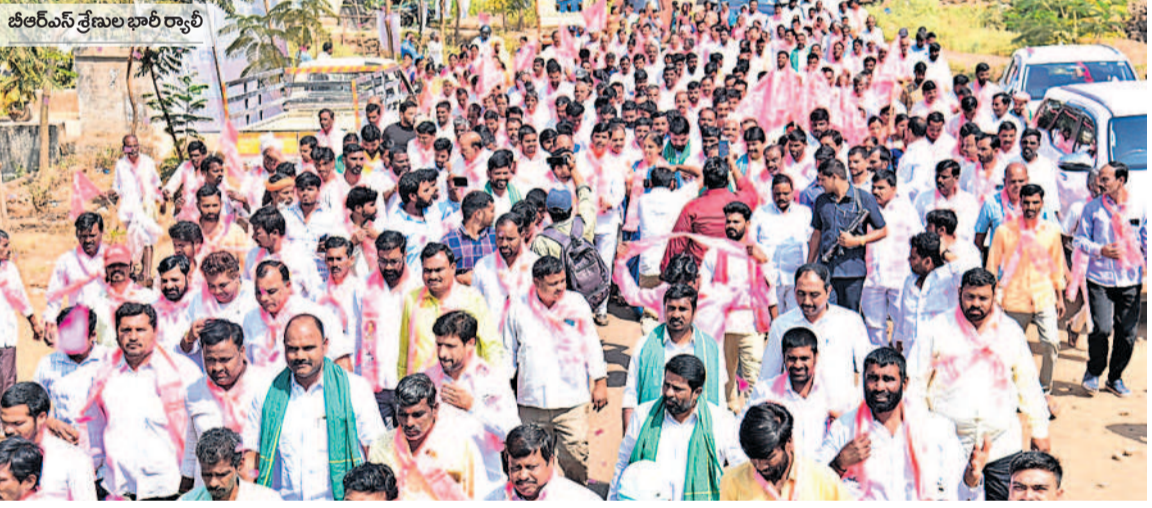
బీఆర్ఎస్ శ్రేణుల భారీ ర్యాలీ