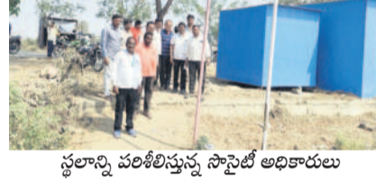
స్థలాన్ని పరిశీలిస్తున్న సానాని అధికారులు