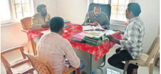
పంచాయతీలో సమస్యలపై దృష్టి సారించాలి