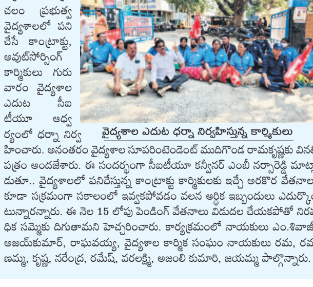
సీపీఐ యాధ్వర్యంలో ఆసుపత్రి కార్మికుల ధర్మా

భద్రాచలం, ఫిబ్రవరి 6: భద్రాచలంలో కొన్ని రోజులుగా జైల్లోను వేగంగా నడుపుతూ పట్టణ వాసులను భయభ్రాంతులను గురి చేస్తున్న ముగ్గురు యువకులను గురువారం పట్టణ పోలీసులు అదుపులోకి తీసుకున్నారు. దీంతో పలువురు వాహన ఛోదకులు పోలీసులకు ఫిర్యాదు చేశారు. ఈ నేపథ్యంలో ట్రాఫిక్ ఎమ్మెల్యే ముచ్చలపాటి వీరి కోసం మూడు రోజులుగా తిరుగుతూ గురువారం పట్టణంలోని ద్వితీయ వాహనాలను ట్రాఫిక్ పోలీస్ స్టేషన్ కు తరలించారు.