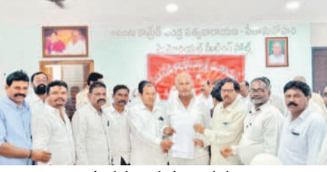
భూనిర్వాసితులకు పరిహారం చెల్లించాలి