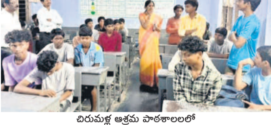
పది విద్యార్థులకు ప్రత్యేక బోధన అందించాలి