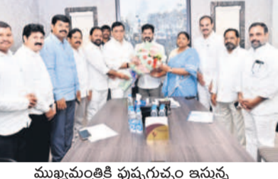
అదివాసీల సంక్షేమంపై సీఎంకు వినతి