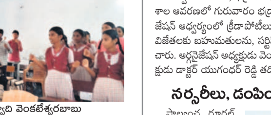
పరీక్షల ఒత్తిడిపై అవగాహన