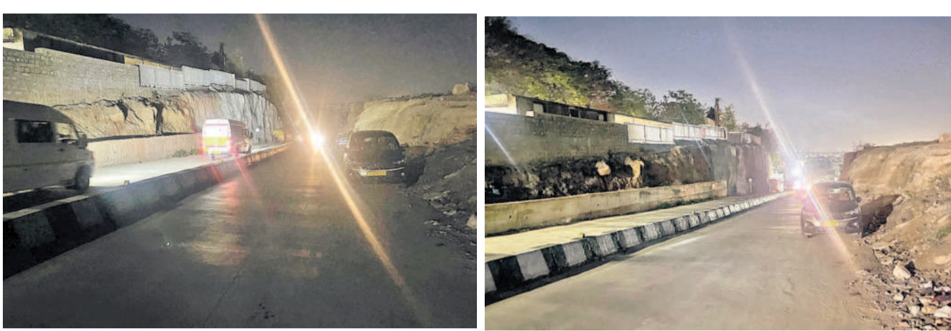
బంజారాహిల్స్ రోడ్డు నంబర్ 2 నుంచి జూబ్లీహిల్స్ రోడ్డు నంబర్ 5 కు వెళ్లే లింక్ రోడ్డులో వీధిదీపాలు లేకపోవడంతో విమ్మటికట్లోనే కొనసాగిస్తున్న రాకపోకలు