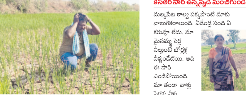
ఇంత గోస ఎవ్వూ పడలేదు

ఎల్లారెడ్డిపేట, ఫిబ్రవరి 6 : ఎల్లారెడ్డిపేట మండలంలోని అల్పాస్పూర్, రాజన్నపేట, కిష్కనాయకతండా, గొల్లపల్లి, దేవునిగుట్టతండా, బాకరపల్లి తండాల్లో సాగునీరు లేక పంటలు ఎండిపోతున్నాయి. గత ఏడేండ్ల కాలంలో ఈ గ్రామల్లోని ప్రతి చెరువు నిండుకుండా మారి బోరుబావుల్లో పుష్కలమైన నీరు ఉండేది. 24 గంటల కరెంటు వచ్చేది. మల్కపేట రిజర్వాయర్ కాలవలో పాత నీరు ఎక్కువై కట్టలు, మత్తడి తెంపిన రోజులు ఉండేవి. ఇప్పుడు అవన్నీ పోయి.. కరెంటు, చంట నీళ్ల కోసం నిద్రలేని రాత్రులు గడుపుతున్న గడ్డుకాలం అనుభవిస్తున్నామని ఆయా గ్రామాల రైతులు ఆవేదన వ్యక్తం చేస్తున్నారు. ఇటీవల ప్రభుత్వం ఏటీ ఆర్ టీనివారినీ వద్దకు వెళ్లి మల్కపేట రిజర్వాయర్ నుంచి కాలవలకు నీళ్లు విడిది రాజన్నపేటలీరు కొచ్చెర్లు, తిమ్మాపూర్లోని మైసమ్మ చెరువు నింపాలని వినతిపత్రం అందించామని, అయినా నీళ్లు రావడం లేదని తెలిపారు. అల్పాస్పూర్ నుంచి మొదలు బాకరపల్లి వరకు సుమారు 8 కిలోమీటర్ల దిడివోల్ కాలవ పరిసరాలను ఆసుకుని సుమారు 800 ఎకరాలు సాగువుతుండగా, నీరు రాకపోవడంతో ఆ పంటల పరిస్థితి ప్రస్తావనగా మారింది. కొచ్చెర్లు, మైసమ్మ చెరువుల్లో నీళ్లు తగ్గి బోరుబావులు ఇంకాపోయాయి. ఇప్పటికే సుమారు 70 ఎకరాల వరకు పంటలు ఎండిపోగా మరో పది రోజులు మిగతా పంటలు కూడా ఎండిపోయే ప్రమాదం ఉండడంతో ఆయా గ్రామాల రైతులు దిక్కుకోసని స్థితిలో పడిపోయారు.