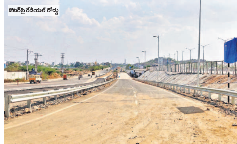
బిటర్ల రేడియల్ రోడ్డు