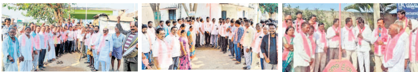
సిద్దిపేట: పుల్లారూర్ బీఆర్ఎస్ జెండాను ఆవిష్కరిస్తున్న నాయకులు