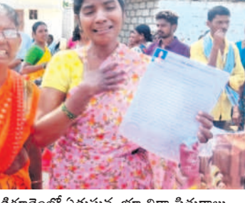
సర్పిరెడ్డి గౌడెంలో ఏడుస్తున్న భూ నిర్వాసితులూ తోడ్పూలాల వెంటకట్టము

గ్రామంలోని 289 ముంపు బాధితులకు గామ వింతపల్లి మండలంలో లాటరీ ద్వారా 257 మందికి ఫ్యాట్ కేటాయించారు. ఇంకా 32 మందికి ఫ్యాట్లు రాలేదని, ఇంకో 15 మందికి ఆర్ఆర్డీ ఆర్ ప్రాజెక్ట్ కింద నష్టప రిహారం అందాల్సి ఉందని బాధితులు వాచి యారు. అధికారులు ఫ్యాట్లను మాత్రమే కేటా యించి ఏ చేతులు దులుపుకొన్నారనీ, వాటి కి కొని పనులు నిలుపుదల చేశారు. కట్టపై టీవీ ధర్షనలు ఆందోళన చేశారు. ఈ సందర్భంగా ముంపు బాధి తులు మాట్లాడుతూ ఈ నెల 10వరకు గ్రామాన్ని ఖాళీ చేయించేందుకు అధికారులు తీవ్ర ఒత్తిడి చేస్తున్న న్నారని తెలిపారు. అందులో భాగంగా రాత్రిపూట విద్యుత్ సరఫరాను కూల్చేసి భయాందోళన సృష్టించారని చెప్పారు. గ్రామాన్ని ఖాళీ చేసిన వారికి కాంట్రాక్టర్లు మాట్లాడి నజరానా కూడా ఇప్పిస్తామని అధికారులు మద్దతువర్తిస్తామని హామీలు పెట్టారు. గ్రామస్థుల మద్దతు ఇక్కడను దెబ్బ తీసేలా కట్టలు చేస్తున్నట్లు ఆవేదన వ్యక్తం చేశారు. సర్వస్వం కోల్పోతున్న భూ నిర్వాసి తుల పట్ల ప్రభుత్వం కర్కర్యమని వ్యవహారం న్నదని మండిపడ్డారు. కనీసం షో బీసీలు కూడా ఇవ్వకుండా అధికారులు గ్రామం లోకి ట్రాక్టర్లను పంపి ఖాళీ చేయమనడం ఎంత వరకు కఠినం అని ప్రశ్నించారు. ఖాళీ చేయించే సమయంలో ప్రభు త్వ అధికారులు ఎందుకు గ్రామానికి రాలేదని నిలదీశారు. మిగిలిన నిర్వాసితులకు ఘోష, ఆరిఆర్డీ ఆర్ ప్రాజెక్ట్ కింద పరిహారం అందించాలని డిమాండ్ చేశారు. భూ నిర్వాసితులను భయపెడుతూ గ్రామాన్ని ఖాళీ చేయాలని చూస్తే ప్రతిఘటన తప్పదని హెచ్చరిం చారు.