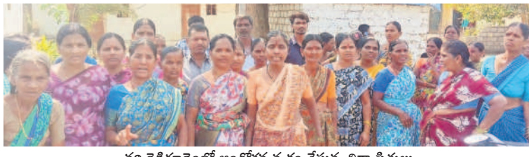
సర్పిరెడ్డి గౌడెంలో ఆందోళన వ్యక్తం చేస్తున్న నిర్వాసితులు