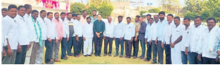
మాజీ మంత్రి జగదీశ్ రెడ్డిని కలిసిన బీఆర్ఎస్ మాజీ సర్పంచ్ గారయకులు

పండించారు. గత ఎన్నికల్లో అలివికాని చేపాటు ఇచ్చి, కేసీఆర్ ను మించి ఏడో వేస్తోమని నమ్ముతుంటే ఓట్లు వేయించుకున్న కాంగ్రెస్ పార్టీ అధికారంలోకి వచ్చిన అనతి కాలంలోనే రైతుల దుస్థితి దయనీయంగా