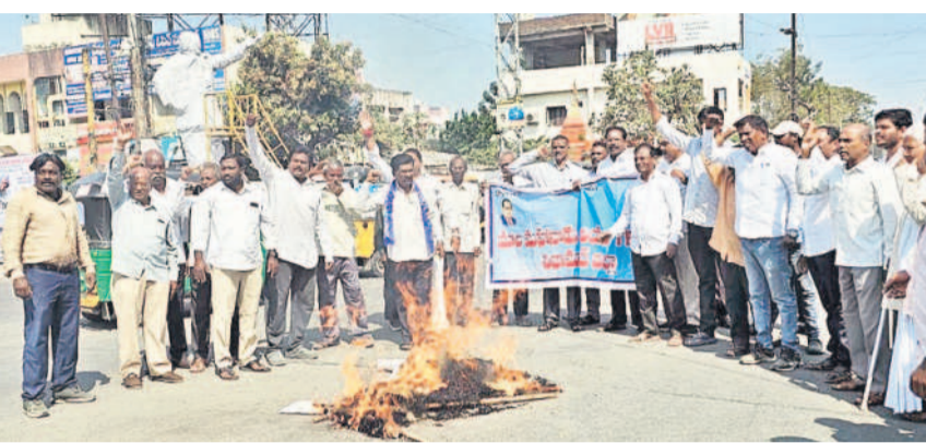
ఎన్టీఆర్ వారసత్వం సీఎం దిష్టిబొమ్మల దహనం చేస్తున్న మాల మహానాడు నాయకులు