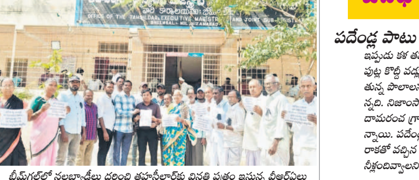
భీమ్‌గల్‌లో సబ్సిడీ రుణాల పంపిణీ అంశంపై వివరించిన వీఆర్‌పిల