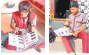
డిజిటల్ కంటెంట్ బుక్స్ తో పాఠాలు వింటున్న విద్యార్థులు