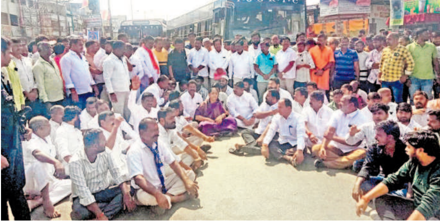
మెదక్ జిల్లా నర్సాపూర్లో రాస్తారోకో చేస్తున్న ఎమ్మెల్యే, టీఆర్ఎస్, అఖిలపక్షం నాయకులు