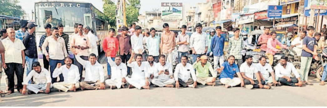
నర్సాపూర్ చౌరస్తాలో రాస్తారోకో చేస్తున్న టీఆర్ఎస్, అఖిలపక్షం నాయకులు

నర్సాపూర్, ఫిబ్రవరి 6: కాలుష్యం కోరల్లోకి నర్సాపూర్ పట్టణం వెళ్తుందంటే ప్రజలు భయపడుతున్నారు. ప్రభుత్వం తీసుకున్న ఒకే ఒక్క నిర్ణయంతో నర్సాపూర్ పరిసర ప్రాంతాల్లోని ప్రజలకు కంటి మీద కుసుకు లేకుండా చేస్తుంది. గుమ్మడిదల, నర్సాపూర్ మండలం డంపింగ్ యార్డ్ ఏర్పాటు చేయాలని ప్రభుత్వం నిర్ణయం తీసుకోవడంతో నర్సాపూర్ పరిసర ప్రాంతాల ప్రజలను ఉలిక్కిపడేలా చేసింది. సంగారెడ్డి జిల్లా గుమ్మడిదల మండలం ప్యాపానగర్ గ్రామ సమీపంలోని అటవీ ప్రాంతంలో డంపింగ్ యార్డ్ ఏర్పాటు చేయాలని ప్రభుత్వం నిర్ణయించింది. ఇదే గమక జరిగితే అటవీ ప్రాంతంలో కురిసిన వర్షం నీరు డంపింగ్ యార్డు నుంచి నేరుగా నర్సాపూర్ రాయారావు చెరువులోకి చేరుతుంది. దీంతో చెరువులోని నీరు, భూగర్భ జలాలు కలుషితం అవుతాయని ప్రజలు ఆందోళన చెందుతున్నారు. కోతులు సైతం డంపింగ్ యార్డులో తిరిగి ఇండ్ల పరిసర ప్రాంతాల్లో తిరిగడంతో జనాలు రోగాల బారిన పడే అవకాశాలున్నాయని ప్రజలు