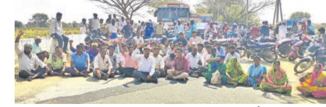
కొండపోచమ్మ కాలనీ ద్వారా చెరువులు నింపాలని ధర్మా చేస్తున్న రైతులు