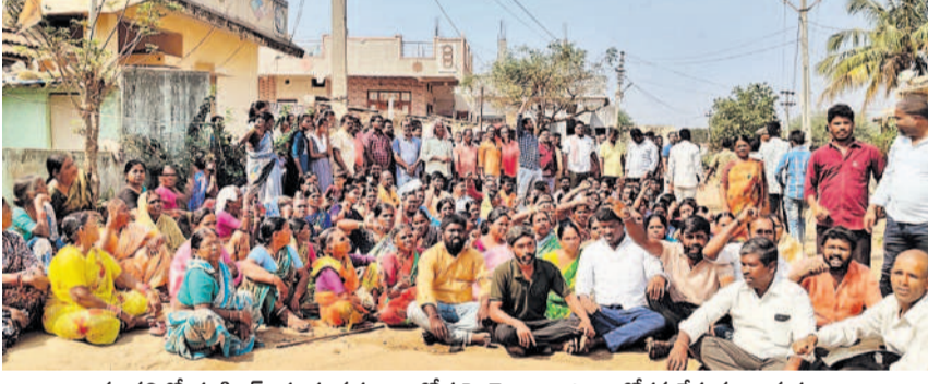
నల్లపల్లిలో డంపింగ్ యార్డు వద్దంటూ రోడ్డుపై బైరాయింది ఆందోళన చేస్తున్న గ్రామస్థులు