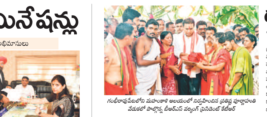
గంభీరావుపేటలో మహాకాళి ఆలయంలో నిర్వహించిన ప్రతిష్ట పూర్ణాచారిత్ర వేడుకలో పాల్గొన్న బీఆర్ఎస్ పర్సనల్ ప్రెసిడెంట్ కేటీఆర్