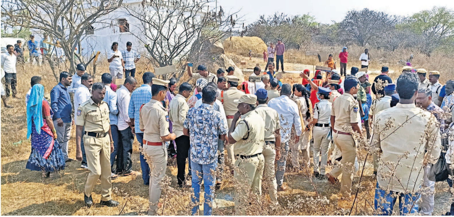
శుక్రవారం సీఎం రేవంత్ రెడ్డి సొంత సయోజకవర్గం కొడంగల్ పరిధిలోని రోటిబండతండాలో రైతులు పొలాల్లోకి వెళ్లకుండా అడ్డుకొంటున్న పోలీసులు