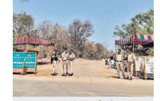
డంపింగ్ యార్డుకు వెళ్లే మార్గంలో పోలీసుల పహారా