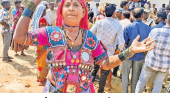
భారీగా పోలీసులను మోహరించడంతో కిష్కిబాయి ఆగ్రహం

కొడంగల్, ఫిబ్రవరి 7 (నమస్తే తెలంగాణ) : ఏడాది కాలంగా సర్కారు వేధింపులను భరిస్తూ.. పోలీసుల దౌర్జన్యం, కేసులు, జైలు తీవ్రతతో వీరికి పోతున్న లగచర్ల, రోటిబండతండా, పులిచర్లకుంట తండాల్లో మళ్లీ ఖాళీలు మోహరించారు. ప్రాణాలైనా ఇస్తాంనా.. భూములివ్వండి లేదు' అని స్పాటిక గిరిజన రైతులు తెగిన చెప్పినారేవంత్ సర్కారు మాత్రం కనికరించడం లేదు. నిన్నటిదాకా ఫార్మా అని చెప్పి, ఇప్పుడు పారిశ్రామికవాడ అని కొత్త రాగంతో కాంగ్రెస్ సర్కార్ భూసేకరణకు కాలు దువ్వుతున్నది. ఇందులో భాగంగా శుక్రవారం వందలాది మంది పోలీసు బలగాలతో లగచర్లకుంట వెళ్లిన రెవెన్యూ అధికారులు సర్వే మొదలుపెట్టారు. కొందరు రైతులు భూములు ఇచ్చేందుకు అంగీకరించారంటూ సర్వే మొదలుపెట్టిన అధికారులు, తాము భూములు ఇచ్చేది లేదని చెప్పిన గిరిజన రైతుల పొలాల్లోకి వెళ్లి చూద్దలు నిర్ధారించుకొని సర్వే చేశారు. ఈ క్రమంలో గిరిజన రైతులు పెద్ద ఎత్తున ప్రభుత్వం ప్రదర్శిస్తూ, నినాదాలు చేస్తూ సర్వేను తీవ్రంగా వ్యతిరేకించారు.