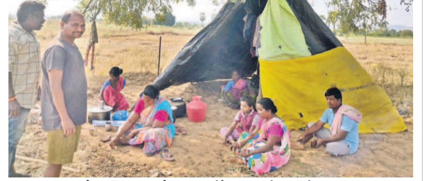
చారకొండలో బైపాస్ నిర్మాణంలో ఇల్లు కూలివేస్తే చెట్లకిందనే గుడిసె చేసుకున్న బాధితుడు