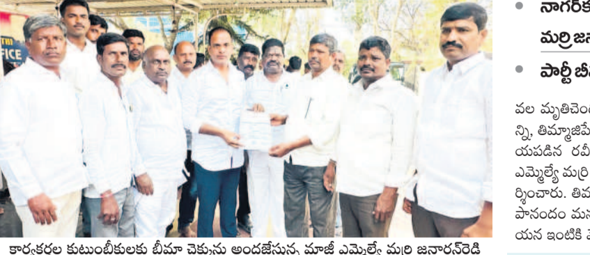
కార్యకర్తల కుటుంబాలకు బీమా చెక్కులను అందజేస్తున్న మాజీ ఎమ్మెల్యే మర్రి జనార్ధన్ రెడ్డి

• నాగర్ కర్నూల్ మాజీ ఎమ్మెల్యే మర్రి జనార్ధన్ రెడ్డి • పాల్గొని బీమా చెక్కుల పంపిణీ పల మృతిచెందిన ఎకక కుర్రయ్య కుటుంబాన్ని, తిమ్మాజిపేట మండలం అప్పాజుపల్లిలో గాయపడిన రవిచంద్రరెడ్డిని శుక్రవారం మాజీ ఎమ్మెల్యే మర్రి జనార్ధన్ రెడ్డి శుక్రవారం పరామర్శించారు. తిమ్మాజిపేటలో మృతిచెందిన కుర్రయ్య కుటుంబానికి కుటుంబ సభ్యులకు అండగా ఉంటామని మాజీ ఎమ్మెల్యే మర్రి జనార్ధన్ రెడ్డి ప్రకటించారు. ఈ సందర్భంగా దవాఖాన అధికారులు మృతిచెందడంతో ఆయన ఇంటికి వెళ్లి పరామర్శించారు. గురుకులాన్ని పరిశీలించిన డి.సి.ఎస్ బాలానగర్, ఫిబ్రవరి 7 : బాలానగర్ మండల కేంద్రంలోని బాలికల గురుకులాన్ని డి.సి.ఎస్ వెంకటేశ్వర్లు శుక్రవారం పరిశీలించారు. గురువారం బాలికల గురుకులంలో నాగర్ కర్నూల్ జిల్లా వెల్లండ మండలం చొక్కన్నపల్లికి చెందిన పదే తరగతి విద్యార్థిని ఆరాధ్య ఉర్రుకుని అత్యంత తీవ్రంగా చేసుకున్న విషయం తెలిసింది. శుక్రవారం ఉదయం గురుకులానికి వచ్చిన డి.సి.ఎస్ బాలికల అత్యంత తీవ్రంగా చేసుకున్న తరగతి గుడిసె పరిశీలించారు. బాలికల బలవస్త్రంజానీ సంబంధించి అధ్యయనం, సిబ్బందితో మాట్లాడారు. అత్యంత తీవ్రంగా వినియోగించిన బీరను పోలీసులు స్వాధీనం చేసుకున్నారు.