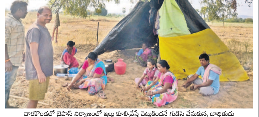
చారకొండలో బైపాస్ నిర్మాణంలో ఇల్లు కూల్చివేస్తే వెళ్లిపోయిన గుడిసె చేసుకున్న బాధితుడు