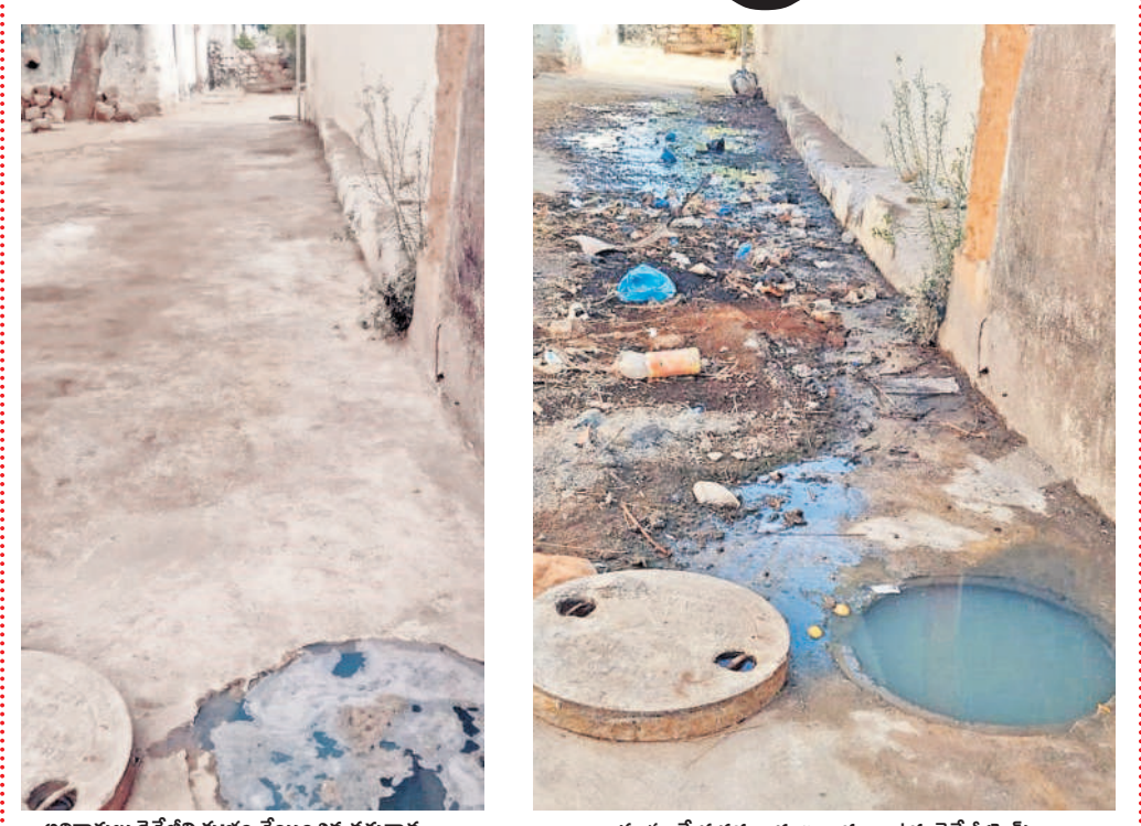
అధికారులు డ్రైనేజీని శుభ్రం చేయించిన తరువాత..