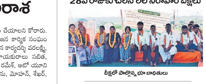
28వ రోజుకు చేరిన రిలే నిరాహార దీక్షలు