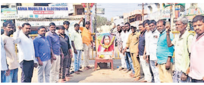
కడ్రాల్: మండల కేంద్రంలో రమాబాయి చిత్రపటం వద్ద నివాళులర్పిస్తున్న నాయకులు

కడ్రాల్, ఫిబ్రవరి 7: మండల కేంద్రంలో శుక్రవారం బీఆర్ అంబేద్కర్ సతీమణి రమాబాయి జయంతిని మూల సంఘం ఆధ్వర్యంలో ఘనంగా నిర్వహించారు. ఈ సందర్భంగా పట్టణంలోని ప్రధాన వార్డుల్లో ఏర్పాటు చేసిన ఆమె చిత్రపటానికి నాయకులు, యువకులు పూలమాలలు వేసి ఘనంగా నివాళులర్పించారు. కార్యక్రమంలో