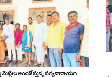
కుటుంబ సంఘాలకు పుస్తకాల అందజేస్తున్న సత్కారాలు