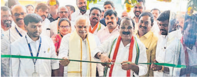
కొత్తూరులో ఆదర్శ కోఆపరేటివ్ అర్బన్ బ్యాంకును ప్రారంభిస్తున్న ఎమ్మెల్యే వీరభద్ర శంకర్