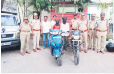
స్వాధీనం ద్వీపక వాహనాలు, పట్టుబడిన దొంగలతో పోలీసులు