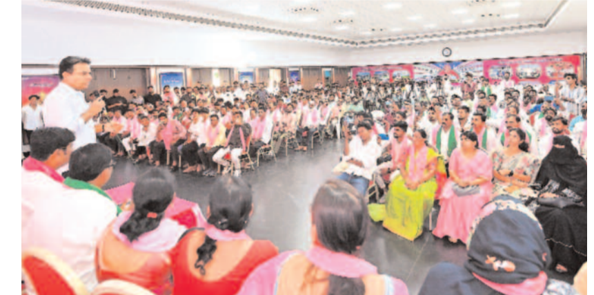
తెలంగాణ భవన్లో శనివారం నిర్వహించిన నిర్దుర్ కాగజేనగర్ నియోజకవర్గ పార్టీ కార్యక్రమం అత్యధిక సమావేశంలో మాట్లాడుతున్న బీఆర్ఎస్ వర్ధిల్ల ప్రెసిడెంట్ కేటీఆర్