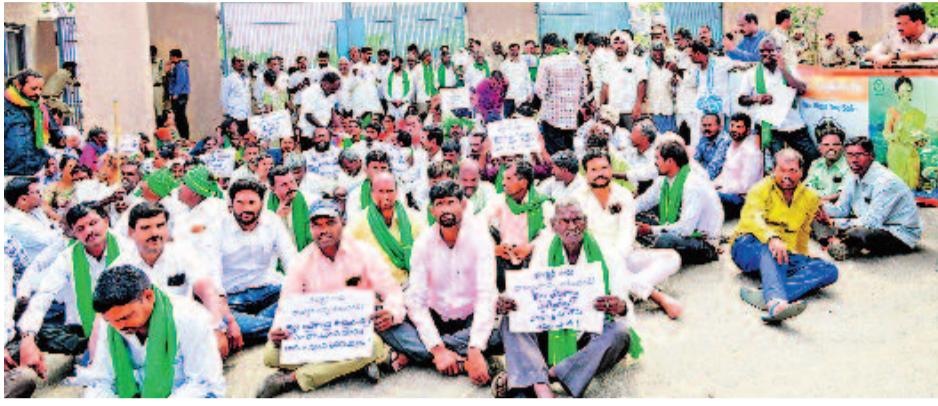
పోలీసులు ఎన్ని అడ్డంకులు నెట్టించినా చేదించకొని పార్టీ వ్యతిరేక పోరాట నమితి రైతులు శనివారం అందోళనకు దిగారు. తమ భూములు ఇచ్చేది లేదంటూ రంగారెడ్డి కలెక్టరేట్ ప్రధాన గేటు ఎదుట జైతూయించి దీక్ష చేశారు.