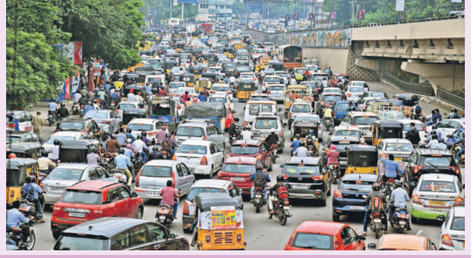
గ్రేటర్ లో వాహనాల సంఖ్య ఇలా..

ఆర్టీసీ బస్సుల్లో దాదాపు 24 లక్షల మంది ప్రయాణిస్తుండగా... మాడుతున్న లక్షల మంది ఎంఎంటిఎస్ తమ గమ్యస్థానాలు చేరుకుంటున్నారు. మెట్రో రైలులో రోజూకు 1.20 లక్షల మంది వరకు ప్రయాణిస్తున్నారు. అయితే ఇంత స్థాయిలో ప్రజారవాణాకు అదరణ అభివృద్ధి చేయాలి అంటే వ్యక్తిగత వాహనాలపై ప్రయాణిస్తున్న వారి సంఖ్య కూడా లక్షల్లో ఉండటం విశేషం.