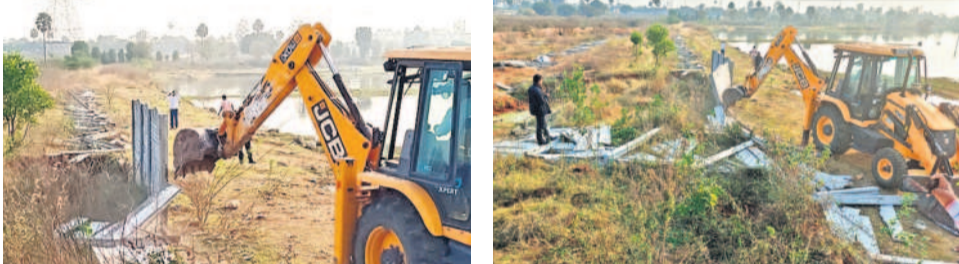
సూరం చెరువులో ఆక్రమణలు తొలగిస్తున్న హైద్రా సిబ్బంది

సిటీబ్యూరో, ఫిబ్రవరి 8 (నమస్తే తెలంగాణ): రంగారెడ్డి జిల్లా తుక్కుగూడ మున్సిపాలిటీ పరిధిలోని సూరం చెరువులో శనివారం హైద్రా కూర్చోవేతలు చేపట్టింది. ఆక్రమణ అనుమతులు లేకుండా చేపట్టిన నిర్మాణాలను కూల్చివేశారు. మాంబల్ పరిధిలోని 139,140 సర్వే నెంబర్లో ఆక్రమణ నిర్మించారంటూ ప్రహారీని, రేకులపై మున్నగు హైద్రా అధికారులు మున్సిపల్ సిబ్బందితో కలిసి జిసిటితో తొలగించారు. సూరం చెరువు మొత్తం విస్తీర్ణం 60 ఎకరాలు కాగా దాదాపు 15 ఎకరాలు స్థానికంగా లేబోర్లు చేస్తున్నవారు కట్టా చేశారని హైద్రా తెలిపింది. చెరువులోకి జరిగి చుట్టూ ప్రహారీ నిర్మించారని, డ్రైనేజీ పైపైలెట్లను కూడా వేశారని రంగారెడ్డి తెలిపారు. ఎఫ్ఐఎల్ పరిధిలో ప్రీకాస్ట్తో నిర్మించిన కాంక్రీట్ వాల్, చుట్టూ ఉన్న పరిస్థితులను స్థానికుల ఫిర్యాదు మేరకు శుక్రవారం రంగారెడ్డి క్షేత్రస్థాయిలో పరిశీలించారు. దీంతో పాటు కొత్త కంటుకు వెళ్లి షేడర్‌చానల్‌ను మూసేయడంతో ఆక్రమణ ఉన్న అడ్డంకిని తొలగించారు. ఇదిలా ఉంటే హైద్రా ప్రజావాణికి చెరువు ఆక్రమణలపై వచ్చిన ఫిర్యాదు మేరకు హైద్రా బృందం మూడురోజుల కిందట నోటీసులు ఇచ్చారు. దీనిపై వారిదగ్గరన్న డాక్యుమెంట్స్ తీసుకురావాలని, ఆక్రమణలపై క్లారిటీ ఇవ్వాలని కోరారు. కానీ ఎలాంటి రెస్పాన్స్ ఇవ్వకపోగా.. వెంచర్ దగ్గర వర్కెక్స్ కెఎల్ఆర్ గిగా పేరుతో బోర్డ్ పెట్టి వెంచర్ చేసి షాట్లు అమ్ముతున్నారని, హైద్రా నోటీసులు ఇవ్వగానే ఆ బోర్డు తొలగించి షాట్ల ఓనర్ల పేరుతో వాల్‌టెలిగ్రఫీని రాయించారు.