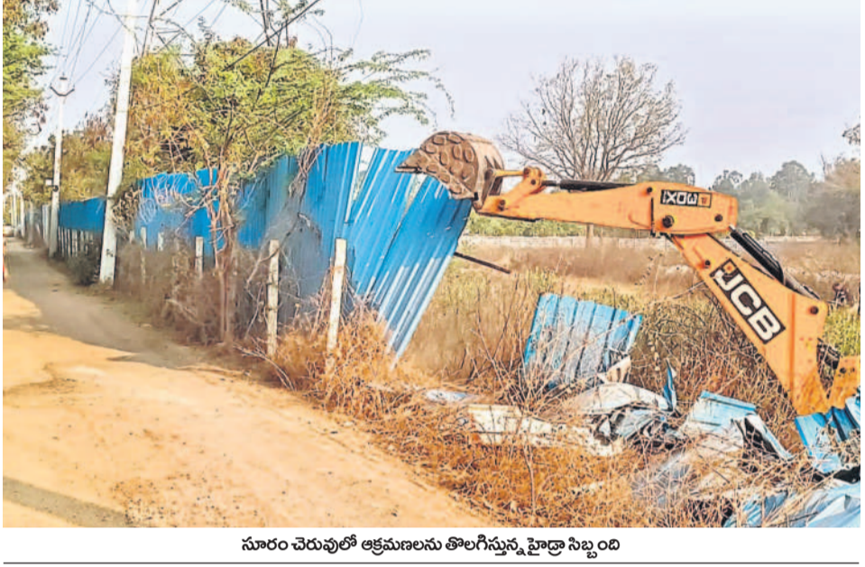
సూరం చెరువులో ఆక్రమణలు తొలగిస్తున్న హైద్రా సిబ్బంది

సమాచారం తెలుసుకుని తమ బోర్డులు తొలగించిన వర్కెక్స్ కెఎల్ఆర్ గిగా