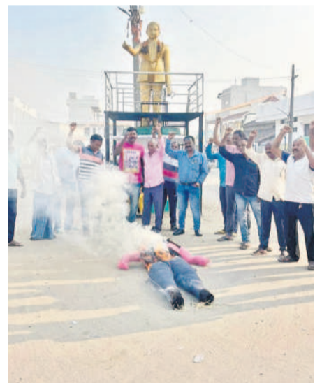
జానంపేట్లో సీఎం దిష్టిబొమ్మను దహనం చేస్తున్న మాలలు

వేల్పూర్ పిల్లవారి 8: కాంగ్రెస్ పార్టీ ఎన్నికల్లో కరణకు చేస్తున్న ప్రయత్నాలకు వ్యతిరేకంగా మాలలు భగ్గుమన్నారు. వేల్పూర్ మండలం లోని జానంపేట్ గ్రామంలో మాల సంఘం ప్రతినిధులు శనివారం ఆందోళనకు దిగారు. అందేద్యర్ విగ్రహం ఎదుట సీఎం రేవంట్ రెడ్డి దిష్టిబొమ్మను దహనం చేశారు. అబద్ధపు హామీలతో గద్దెనెక్కేసే సీఎం రేవంట్ రెడ్డి ప్రజలకిచ్చిన హామీలు నెరవేరడంలో విఫలమయ్యారని వారు మండిపడ్డారు. దేశంలో ఏ రాష్ట్రం కూడా ఎన్ని వర్గకరణకు ముందుకు రాలేదని, పాలన చేతకాని రేవంట్ రెడ్డి ఈ విషయంలో అత్యుత్సాహం ప్రదర్శిస్తున్నారని ధ్వజమెత్తారు. అన్నదమ్ములకూ కలిసి ఉన్న మాల, మాదిగలను విడదీస్తున్నారని విమర్శించారు. కాంగ్రెస్ పార్టీకి తగిన బుద్ధి చెబుతామని హెచ్చరించారు.