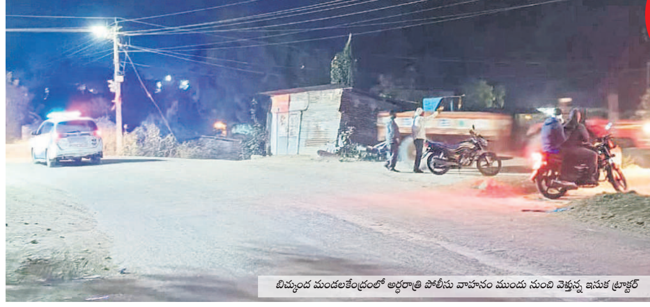
బిమ్మండ మండలకేంద్రంలో అర్ధరాత్రి పోలీసు వాహనం ముందు నుంచి వెళ్తున్న ఇసుక ట్రాక్టర్