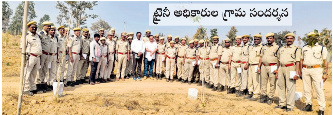
ట్రైని అధికారుల గ్రామ సందర్శన

మాచారెడ్డి మండలంలోని చుక్కాపూర్ గ్రామాన్ని శనివారం అటవీశాఖ ట్రైని సెక్షన్ అధికారులు బృందం సందర్శించింది. ఈ సందర్భంగా వాసకాలంలో నాటిన మొక్కలను