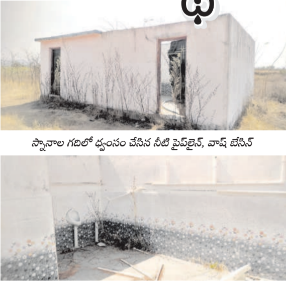
స్నానాల గదిలో ధ్వంసం చేసిన నీటి పైప్ లైన్, వాష్ బేసిన్

అక్కడ అంత్యక్రియలు చేసేందుకు గ్రామస్థులు అవస్థలు పడుతున్నారు. స్నానాల గది నిర్మించినప్పటికీ పైకప్పు లేకపోవడం గమనార్హం. వైకుంఠధామం నిర్మాణ పనులు నాసిరకంగా చేపట్టడంతో గోడలకు అక్కడక్కడా పగుళ్లు ఏర్పడ్డాయి. వైకుంఠధామం ప్రధాన ద్వారం ఆర్కిట్ బిగించిన ప్రధాన గేటును దాని పిల్లలలో ఇరికించారు. వైకుంఠధామంలో నీటి పైప్ లైన్, వాష్ బేసిన్లను పోకిరీలు ధ్వంసం చేసినా పట్టించుకోనే వారు లేరు. సంబంధిత అధికారులు చొరవ తీసుకొని వైకుంఠధామంలో నీటి సౌకర్యం, ఇతర వసతులు కల్పించాలని గ్రామస్థులు కోరుతున్నారు.