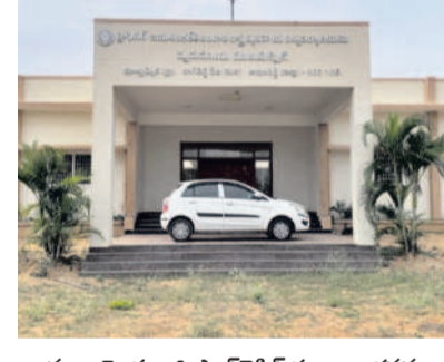
మాల్కొమ్మెడ అగ్రి పాలిటెక్నిక్ కళాశాల భవనం

నాగిరెడ్డిపేట, ఫిబ్రవరి 8: గ్రామీణ ప్రాంతాల్లోని ప్రభుత్వ పాఠశాలలోని 10 పాసైన విద్యార్థులకు బంగారు భవిష్యత్తును అందించేందుకు గత ప్రభుత్వం ఏర్పాటు చేసిన మాల్కొమ్మెడ వ్యవసాయ పాలిటెక్నిక్ కళాశాల నేడు అధికారుల నిర్లక్ష్యంతో మూత పడింది. గుట్టు చచ్చుడు కాకుండా సంఖ్యను తక్కువగా చూపుతూ.. కళాశాల విద్యార్థులను తరలింపేందుకు ఏర్పాటు చేస్తుండడంతో గుర్తించిన 'నమస్తే' తెలంగాణ గత ఏడాది డిసెంబర్ 29న 'మాల్కొమ్మెడ వ్యవసాయ పాలిటెక్నిక్ కళాశాల నిర్లక్ష్యంపై నీలినీడలు' కథనం ప్రచురించింది. స్థానిక అధికారులు, ప్రజాప్రతినిధులు, రాజకీయ పార్టీల నాయకులు స్పందించి కళాశాల తరల