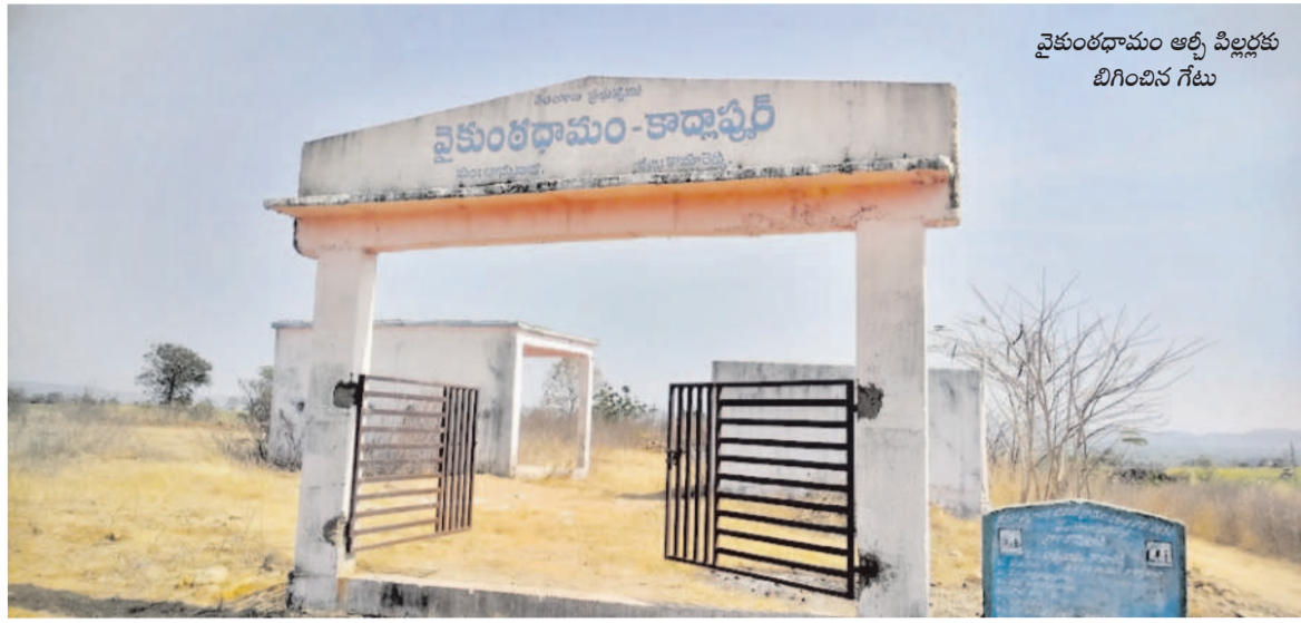
వైకుంఠధామం ఆర్ట్స్ పిల్లలకు బిగించిన గేటు