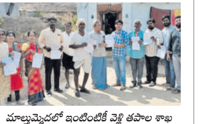
మాల్కొమ్మెడలో ఇంటింటికీ వెళ్లి తపాలా శాఖ పథకాలపై అవగాహన కల్పిస్తున్న సిబ్బంది