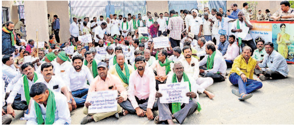
పోలీసులు ఎన్ని అధికారులు న్యూస్ బిసినెస్ ఛేదించకొని ఫార్మా వ్యతిరేక పోరాట నమితి రైతులు శనివారం ఆందోళనకు దిగారు. తమ భూములు ఇచ్చేది లేదంటూ రంగారెడ్డి కలెక్టరేట్ ప్రధాన గేటు ఎదుట ఖైదయించి దీక్ష చేశారు.