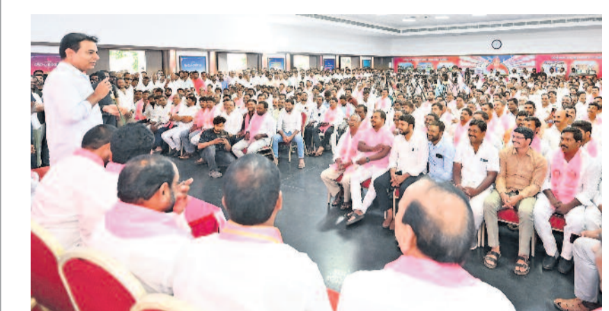
తెలంగాణ భవన్లో శనివారం నిర్వహించిన వికారాబాద్ నియోజకవర్గ పార్టీ కార్యకర్తల ఆత్మీయ సమావేశంలో మాట్లాడుతున్న బీఆర్ఎస్ వర్కర్ ప్రెసిడెంట్ కేటీఆర్

మహారాష్ట్రనుంచి పార్టీ పతనాన్ని శాసించింది రాజీయ రోజుల్లో ఇంకా దానిని కొనసాగిస్తూ దేశంలో బీజేపీని గెలిపిస్తున్న రాహుల్ గాంధీ మోటికి, బీజేపీకి ఆయనే అతిపెద్ద ప్రచారకర్త బీఆర్ఎస్ నుంచి మోసగాళ్లంతా వెళ్లిపోయారు ఇప్పుడున్నది నికార్సైన కార్యకర్తలు, నాయకులే వవర్ కోసం పార్టీ మారే అవకాశాలు వద్దు కాంగ్రెస్ ప్రభుత్వంపై అసహనం ప్రజల్లోకి తీసుకెళ్లి స్థానిక ఎన్నికల్లో పార్టీ అభ్యర్థులను గెలిపించాలి రాష్ట్ర ప్రజల ఆశీర్వాదంతో కేసీఆర్ మళ్లీ మళ్లీ సర్కార్ కాగజేసగర్, వికారాబాద్ నియోజకవర్గాల పార్టీ కార్యకర్తల ఆత్మీయ సమావేశంలో కేటీఆర్ దిశానిర్దేశం