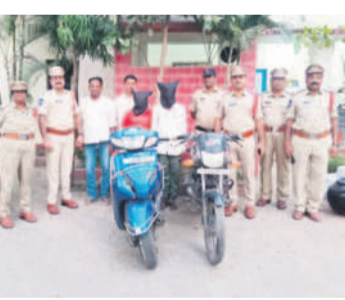
స్వాధీనం ద్వితీయ వాహనాలు, పట్టుబడిన దొంగలతో పోలీసులు