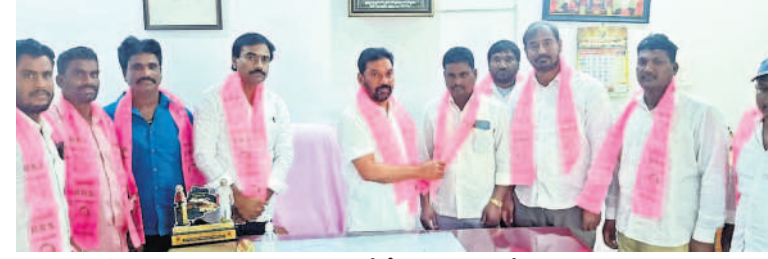
మాజీ ఎమ్మెల్యే వైకే శేఖర్ రెడ్డి సమక్షంలో బీఆర్ఎస్ పార్టీలో చేరిన కాంగ్రెస్ నాయకులు