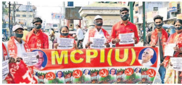
మిర్యాలగూడలో అంబేద్కర్ విగ్రహం వద్ద నిరసన వ్యక్తం చేస్తున్న ఎంసీపీఎం(యా) నాయకులు