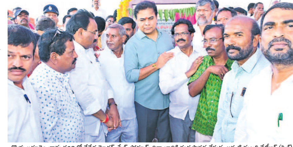
కొయ్యలగూడెం గ్రామ పరిధిలో చేనేత మోడర్న్ సేల్స్ షోరూమ్ నిర్మాణానికి శంకుస్థాపన చేస్తున్న అప్పటి మంత్రి కేటీఆర్ (పై)

గత బీఆర్ఎస్ ప్రభుత్వం చర్యలకు ఉపకమించింది. అందులో భాగంగా చౌటుప్పల్ మండలంలోని కొయ్యలగూడెంలో చేనేత మోడర్న్ సేల్స్ షోరూమ్ ఏర్పాటు చేయాలని నిర్ణయించింది. ఆ మేరకు అప్పట్లో రూ.95 లక్షలు కూడా మంజూరు చేసింది. తొలుత 10 శాతం మేర 9.5 లక్షలు విడుదల చేస్తూ అధికారంలో రాగా, పట్టించుకునేవారు కరువయ్యారు. పాలనా పగలు చేపట్టి ఏడాది దాటినా చేనేత మోడర్న్ షోరూమ్ నిర్మాణాన్ని పట్టించుకున్న దాఖలాలు లేవు.