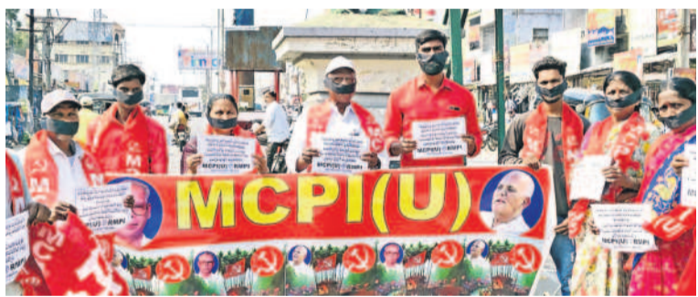
మిర్యాలగూడలో అంబేద్కర్ విగ్రహం వద్ద నిరసన వ్యక్తం చేస్తున్న ఎంసీపీఐ(యూ) నాయకులు