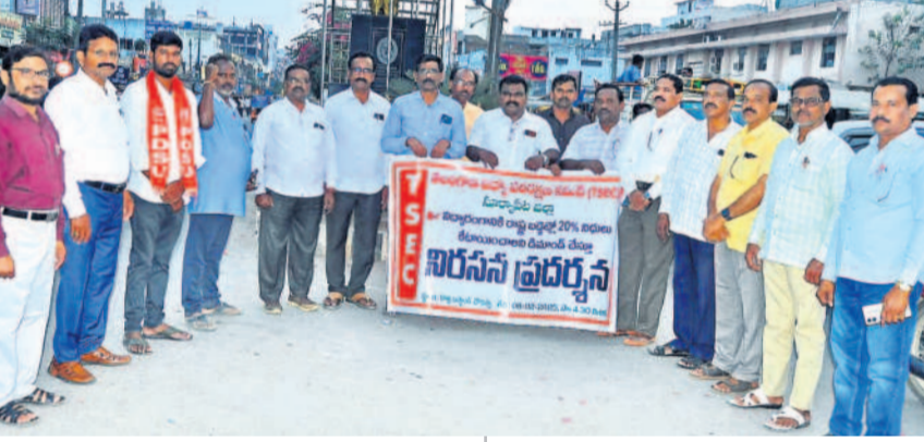
సూర్యాపేట కొత్త బస్టాండ్ వద్ద నిరసన వ్యక్తం చేస్తున్న తెలంగాణ విద్యా పరిక్షణ కమిటీ సభ్యులు