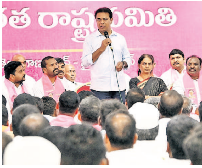
హైదరాబాద్ జిల్లాలోని భవనాల్లో నిర్వహించిన కార్యక్రమ సమావేశంలో మాట్లాడుతున్న జిల్లాలోని ఎంపీలతో పులివెందులూ కేటీఆర్