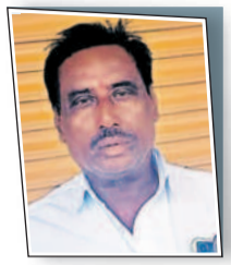
జుకా ప్రభుత్వం మాటలతో మభ్యపెట్టేలా ఉంది.