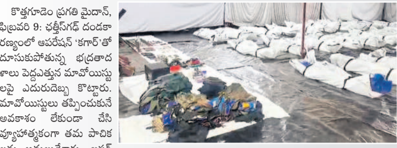
బీజాపూర్లో భద్రపరిచిన మావోయిస్టుల మృతదేహాలు, వస్తువులు

కొత్తగూడెం ప్రగతి మైదాన్, ఫిబ్రవరి 9: భద్రాద్రి కొత్తగూడెం రెవెన్యూ డివిజన్లో ఆపరేషన్ కార్యక్రమం దూసుకుపోతున్న భద్రతాదళాలు పెద్దఎత్తున మావోయిస్టులపై ఎదురుదెబ్బ కొట్టారు. మావోయిస్టులు తప్పించుకునే అవకాశం లేకుండా చేసి వ్యూహాత్మకంగా తమ పాదాలను అడుగుపెట్టారు. బస్టర్ రెంజ్ ఐజీ సుందర్లాళ్ పాలి