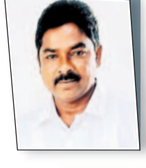
బీసీలను మోసం చేస్తున్న కాంగ్రెస్

సార్వరౌజకీయాల కోసం కాంగ్రెస్ ప్రభుత్వం కుల గణన సర్వే చేపట్టింది. బీసీలకు రిజర్వ్ షస్సు పెంచాలి వస్తుందని అసంపూర్ణ సర్వే చేసి చేతులు దులుపుతుంది. కేసీఆర్ సమగ్ర కుటుంబ సర్వే 100 శాతం చేస్తే.. కాంగ్రెస్ ప్రభుత్వం 97 శాతమే పూర్తి చేసింది. బీసీలను తగ్గించి..