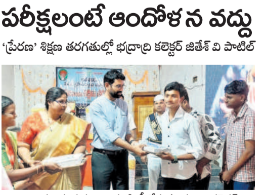
విద్యార్థులకు పుస్తకాలు పంపిణీ చేస్తున్న భద్రాద్రి కలెక్టర్

'పేరణ' శిక్షణ తరగతుల్లో భద్రాద్రి కలెక్టర్ జిత్తే వి పాటిల్