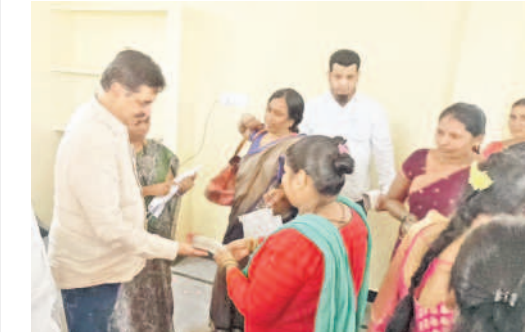
మహిళా గ్రూపు సభ్యులకు అధిక సహాయాన్ని అందజేస్తున్న ఎమ్మెల్యే అబ్దుల్లా బలాల

మలక్వేల, ఫిబ్రవరి 9 : స్వయం సహాయక మహిళా గ్రూపులకు ప్రభుత్వం అందిస్తున్న అధిక సహాయాన్ని సద్వినియోగపరచుకొని మహిళలు అధిక స్వావలంబనను సాధించాలని మలక్వేల ఎమ్మెల్యే అబ్దుల్ బలాల అభ్యుత్థి కోరారు. పాత మలక్వేల డివిజన్ లోని పద్మా నగర్ కాలనీలో 20 మంది స్వయం సహాయక మహిళా గ్రూపు సభ్యులకు రూ. 20 లక్షల అధిక సహాయాన్ని అందజేశారు ఈ సందర్భంగా ఆయన మాట్లాడుతూ మహిళల అధిక స్వావలంబన కుటుంబ ఎదుగుదలకు ఎంతో దోహదపడుతుందన్నారు. మహిళల అధికంగా ఎదిగేందుకు ప్రభుత్వం స్వయం సహాయక గ్రూపు మహిళా సంఘాలకు పాపలా వడ్డీ రుణాలను మంజూరు చేయటం జరుగుతుందని తెలిపారు. మహిళలు అన్ని రంగాల్లో రాజీనామాలు ప్రభుత్వం తరఫున ఎలాంటి సహాయం కావాలన్నా తాను అభ్యుత్థి చేయాలని కోరారు. కాన్యానని అభివృద్ధి అధికంగా స్వావలంబన సాధించి కుటుంబ పోషణలో పురుషులకు చేదోడు వాడొద్దగా ఆయన అన్నారు. ఈ కార్యక్రమంలో పద్మా నగర్ స్వయం సహాయక మహిళా గ్రూపు సభ్యులు డివిజన్ ఎంపీ అబ్దుల్లా బలాల మాట్లాడుతూ పేద ప్రజల సేవలో విధంగా ఉన్న కేంద్ర బడ్జెట్ ను నిరసిస్తూ సోమవారం