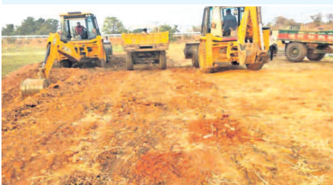
టీవీ డ్రైవర్ల మట్టిని నింపుతున్న జేసీబీలు

కందుకూరు, ఫిబ్రవరి 9 : మండలంలో యధేచ్ఛగా మట్టి దండా కొనసాగుతుంది. రాత్రియందంటే చాలు వందల టీవీ డ్రైవర్లతో హైదరాబాద్లో పాటు ఇతర ప్రాంతాలకు మట్టిని తరలిస్తున్నారు. మండలంలోని 35 గ్రామ పంచాయతీలతో పాటు అనుబంధ గ్రామాల్లో మట్టి తరలింపు కొనసాగుతుంది. సంబంధిత అధికారులు మామూళ్లకు అలవాటు పడి చూసే చూడకట్టు వ్యవహారాన్ని న్యాయ స్థాయిలో అధిగోలుస్తున్నారు. దీంతో మట్టి తరలింపులో అక్రమార్కులు లక్షల రూపాయలు కొల్లగొడుతున్నారు. ఎవరైనా ఫిర్యాదు చేస్తే తూతూ మంత్రంగా కేసులు పెట్టి ఫిర్యాదు చేసిన వారి పేర్లను అక్రమార్కులు