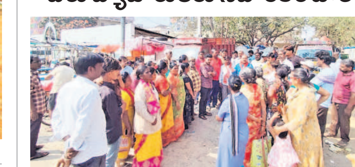
చిరు వ్యాపారుల సహకారంతో మాట్లాడుతున్న సీబీబీయూ నాయకులు

పసర్లపూర్, ఫిబ్రవరి 9 : పసర్లపూర్ రైతుబజార్ సమీపంలో ఉన్న చిరువ్యాపారులకు పసర్లపూర్ కాలనీ సంఘం సహకారం అందించాలని సీబీబీయూ ఎల్సీనగర్ కమిటీ సభ్యులు అభ్యుత్థి కోరారు. ఆదివారం రైతుబజార్ సమీపంలో చిరువ్యాపారులతో సమావేశం నిర్వహించారు. ఈ సందర్భంగా ఆయన మాట్లాడుతూ రెక్కాడికి కాసి డొకా చొరవ తీసుకొని మట్టి దండాను అరికట్టాలని ప్రజలు కోరుతున్నారు.