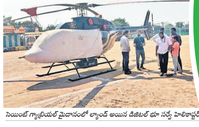
నియంత్రణ గ్యాల్లియట్ మెదానంలో ల్యాండ్ అయిన డిజిటల్ భూ సర్వే హెలికాప్టర్

సంబంధిత ఉన్నతాధికారుల ఆదేశాలతో నియంత్రణ గ్యాల్లియట్ మెదానంలో హెలికాప్టర్ను దింపామని తెలిపారు. సోమవారం వర్షం వేట, తొర్రారు, నర్సాపేట, పరకాల తదితర పట్టణాల్లో ఏరియల్ డిజిటల్ సర్వే చేయనున్నట్లు తెలిపారు. ఆ తర్వాత ఖమ్మం జిల్లాలో సర్వే నిర్వహిస్తామని చెప్పారు.