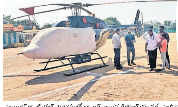
సెయిట్ గ్యాబ్రియేల్ మైదానంలో ల్యాండ్ అయిన డిజిటల్ భూ సర్వే హెలికాప్టర్

వర్షం వేట, తొర్రారు, నర్లంపేట, పరకాల తదితర పట్టణాల్లో ఏడీఎస్ హెలికాప్టర్లతో అధునిక తేమెరాలు అమర్చి భూమి వివరాల నమోదు కాజీపేట, ఫిబ్రవరి 9 : కేంద్ర ప్రభుత్వం చేపట్టిన ఏరియల్ భూ సర్వేలో భాగంగా సోమవారం వర్షంవేట, తొర్రారు, నర్లంపేట, పరకాల తదితర పట్టణాల్లో డిజిటల్ సర్వే చేయనున్నారు. 'సక్ష' పథకంలో ఎలాంటి ప్రజా కిలలు లేని విస్తృత పట్టణాలను ఎంపిక చేసుకున్న కేంద్ర బృందం శాస్త్ర సాంకేతిక పరిజ్ఞానం కలిగిన కెమెరాలను ఆపరియి హెలికాప్టర్ ద్వారా ఏరియల్ సర్వే చేస్తుంది. చిన్న పట్టణం, గ్రామాల్లోని చెరువులు, కాల్వలు, కోట్లు, రైలు మార్గాలు, ప్లాట్ల విస్తీర్ణం వైర్లు తదితర అంశాలను సర్వే చేసి అక్షాంశాలు, రేఖాంశాలను నమోదు చేయడంతో పాటు అన్ని ఫోటోలు, వీడియోలను తీసుకుంటుంది. ఈ సందర్భంగా సర్వే బృందం ప్రతినిధులు మాట్లాడుతూ ఆదివారం జగిత్యాల నుంచి హుస్సాబాద్ మీదుగా చిన్న పట్టణాలు, గ్రామాలను సర్వే చేశామన్నారు. సాయంత్రం కావడంతో