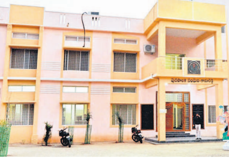
కామారెడ్డి, ఫిబ్రవరి 9: కామారెడ్డి మున్సిపల్ లో కమిషనర్ల బదిలీ పర్వం కొనసాగుతున్నది. తరచూ కమిషనర్ల బదిలీల వ్యవహారం పట్టణవాసులను విస్మయానికి గురిచేస్తున్నది. ఇటీవలే తక్కువ కాలంలో ఎక్కువ సంఖ్యలో కమిషనర్లు మారారు. పూటకొకరు బదిలీ మారినా ఏడాదిలో ఏడుగురు కమిషనర్లు బదిలీ కావడం గమనార్హం. పాలకపర్లం ఉన్నప్పుడు కమిషనర్లు తరచూ మారడంపై వివాదం చెలరేగింది. ఇప్పుడు పాలకపర్లం రద్దయినప్పటికీ నెల రోజుల వ్యవధిలోనే కమిషనర్లు మారడం చర్యని యోగంగా మారింది. ఈ బదిలీలపై అధికార పార్టీ నేతల హాస్సు ఉందా అనే అనుమానాలు ప్రజల్లో వ్యక్తమవుతున్నాయి.