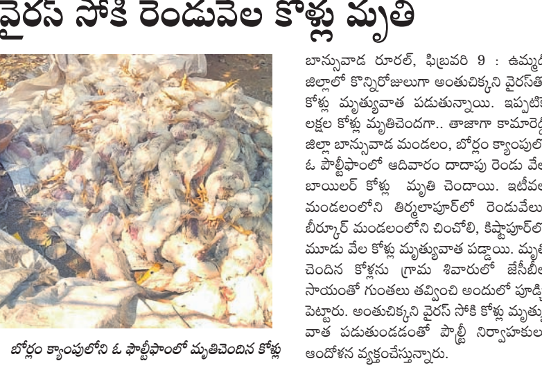
వైరస్ సోకి రెండువేల కోళ్లు మృతి బాన్సువాడ రూరల్, ఫిబ్రవరి 9 : ఉమ్మడి జిల్లాలో కొన్నిరోజులుగా అంతుచిక్కని వైరస్ తో కోళ్లు మృత్యువాత పడుతున్నాయి. ఇప్పటికే లక్షల కోళ్లు మృతిచెందగా... తాజాగా కామారెడ్డి జిల్లా బాన్సువాడ మండలం, బోర్లం క్యాంపులో ఓ ఫాల్జీఫాంట్ ఆదివారం దాదాపు రెండు వేల బాన్సుల కోళ్లు మృతి చెందాయి. జిల్లాల మండలంలోని తిర్లూపూర్ లో రెండువేలు, దీర్ఘాల్ మండలంలోని చింపాల్, కిష్టాపూర్ లో మూడు వేల కోళ్లు మృత్యువాత పడ్డాయి. మృతి చెందిన కోళ్లను గ్రామ శివారులో జేసీబీల సాయంతో గుంతలు తవ్వించి అందులో పూడ్చి పెట్టారు. అంతుచిక్కని వైరస్ సోకి కోళ్లు మృత్యు వాత పడుతుండడంతో ఫాల్జీ ఫిర్యాదులు అందోళన వ్యక్తం చేస్తున్నారు.