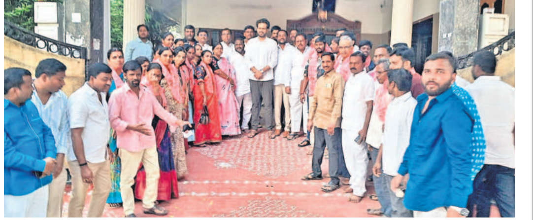
బీఆర్ఎస్ రాజేంద్రవరం నియోజకవర్గ ఇన్-చార్జ్ కార్మికరెడ్డి సమక్షంలో బీఆర్ఎస్ లో చేరుతున్న పలువురు నాయకులు