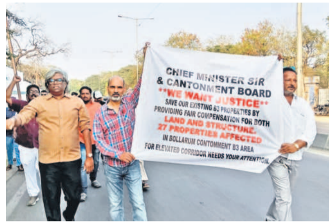
ఎలివేటిడ్ కాలనీ నిర్మాణంలో భాగంగా నివాసాలు కోల్పోతున్న తమకు భూమితో పాటు ఇంటికి నష్టపరిహారాన్ని అందించాలని డిమాండ్ చేస్తూ ఆదివారం బోల్లారం నుంచి లక్ష్మవరం బస్టాండ్ వరకు ర్యాలీ తీసిన స్థానికులు. - బోల్లారం