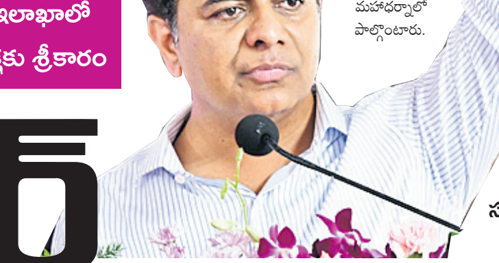
భారీ ఎత్తున రైతులను సమీకరించేందుకు బీఆర్ఎస్ ప్లాన్