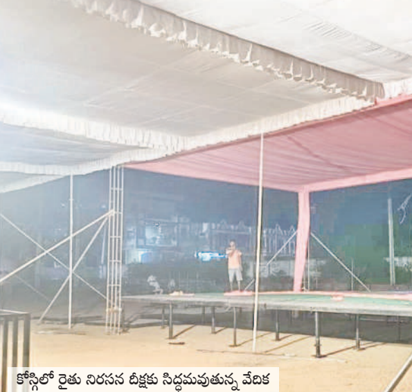
కోస్కిలో రైతు నిరసన దీక్షకు సిద్ధమవుతున్న చెవిక