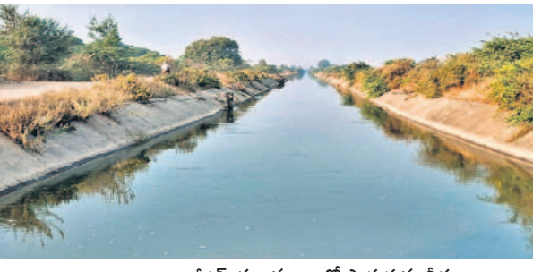
ఆర్డీఎస్ ప్రధానకాల్యలో పారుతున్న నీరు

అయిజ, ఫిబ్రవరి 9 : తుంగభద్ర నదిలో నీటి ప్రవాహం నిలిచి పోతుండడంతో కర్ణాటక లోని ఆర్డీఎస్ ఆనకట్టలో నీటి నిల్వ క్రమేపీ తగ్గుతోంది. టీటీ డ్యాం నుంచి నీటి విడుదల నిలిచిపోయి ఐదు రోజుల క్రితం ఆనకట్టలో నీటి నిల్వ తగ్గుముఖం పట్టడంతో ఆర్డీఎస్ రైతులతో పాటు అధికారుల్లో ఆందోళన మొదలైంది. మార్చి చివరి వరకు ఆర్డీఎస్, తుమ్మిళ్ల ఆయకట్టులో యాసంగిలో సాగు చేసిన పంటలకు సాగునీరు అందాల్సి ఉండగా, ఫిబ్రవరిలోనే ఆర్డీఎస్ ఆనకట్టలో నీటి మట్టం తగ్గుతుండడంతో పంటలు సాగు చేసిన రైతుల్లో గుబులు కెక్కతోంది. ఆర్డీఎస్ నీటి వాటా 5.8 టీఎంసీలకు గానూ ఇప్పటికే 3 టీఎంసీల నీటిని ఆయకట్టుకు విడుదల చేశారు. మరో 2.8 టీఎంసీలు