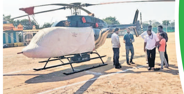
సెయిట్ గ్యాబ్రియెల్ మైదానంలో ల్యాండ్ అయిన డిజిటల్ భూ సర్వే హెలికాప్టర్

కాజీపేట, ఫిబ్రవరి 9 : కేంద్ర ప్రభుత్వం చేపట్టిన ఏరియల్ భూ సర్వేలో భాగంగా సోమవారం వర్షం వేట, తొర్రారు, నర్సాపేట, పరకాల తదితర పట్టణాల్లో డిజిటల్ సర్వే చేయనున్నారు. 'సక్ష' పథకంలో ఎలాంటి ప్రజా కిక్ లేని విస్తృత పట్టణాలను ఎంపిక చేసుకున్న కేంద్ర బృందం శాస్త్ర సాంకేతిక పరిజ్ఞానం కలిగిన కెమెరాలను అమర్చి హెలికాప్టర్ ద్వారా ఏరియల్ సర్వే చేస్తున్నది. చిన్న పట్టణం, గ్రామాల్లోని చెరువులు, కాల్వలు, కోట్లు, రైలు మార్గాలు, హై టెన్షన్ విద్యుత్ వైర్లు తదితర అంశాలను సర్వే చేసి అక్షాంశాలు, రేఖాంశాలను నమోదు చేయడంతో పాటు అన్ని ఫోటోలు, వీడియోలను తీసుకుంటుంది. ఈ సందర్భంగా సర్వే బృందం ప్రతినిధులు మాట్లాడుతూ ఆదివారం జగిత్యాల నుంచి హుస్సాబాద్ మీదుగా చిన్న పట్టణాలు, గ్రామాలను సర్వే చేశామన్నారు. సాయంత్రం కావడంతో