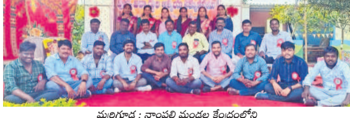
మిర్యాలగూడ : నాంపల్లి మండల కేంద్రంలోని విజ్ఞాన ఉన్నత పాఠశాలలో పూర్వ విద్యార్థులు