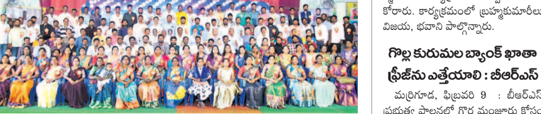
ముసుగోడు జడ్చిపావన్ పూర్వ విద్యార్థులు, ఉపాధ్యాయులు