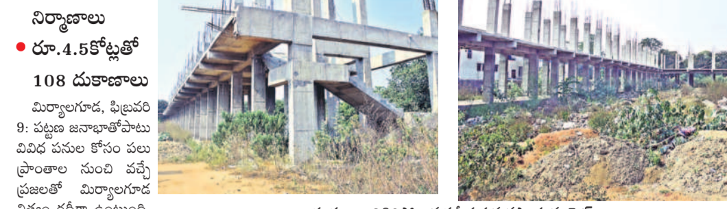
అసంపూర్ణగా నిలిచిపోయిన సమీకృత వ్యవసాయ మార్కెట్