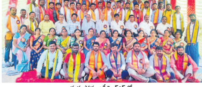
గుర్రంపాడు జడ్చిపావన్ లో.

మిర్యాలగూడ(నాంపల్లి), ఫిబ్రవరి 9 : నాంపల్లి మండల కేంద్రంలోని విజ్ఞాన ఉన్నత పాఠశాలకు చెందిన 2011-12 బ్యాచ్ 10వ తరగతి పూర్వ విద్యార్థులు అధికారం ఆ పాఠశాల ఆవరణలో సమ్మేళనమయ్యారు. ఈ సందర్భంగా ఆహూత పురుషులను సన్మానించారు. కార్వక్కమంత్రి ఉపాధ్యాయులు తిరు