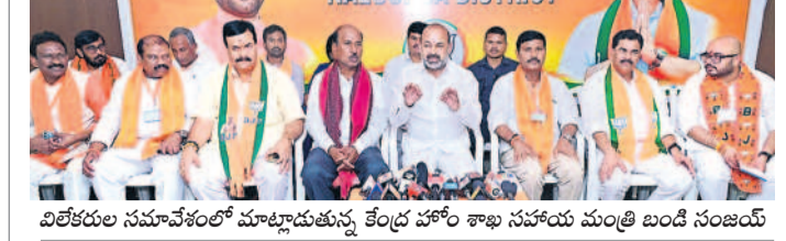
విలేజరుల సమావేశంలో మాట్లాడుతున్న కేంద్ర హోం శాఖ సహాయ మంత్రి బండి సంజయ్