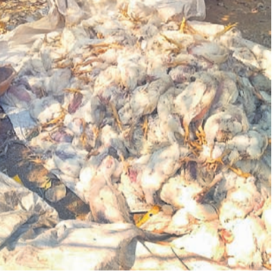
బోర్లం క్యాంపులోని ఓ ఫ్యాబ్రికాలోని మృతిచెందిన కోళ్లు

బాన్సువాడ రూరల్, ఫిబ్రవరి 9 : ఉమ్మడి జిల్లాలో కొన్నిరోజులుగా అంతుచిక్కని వైరస్ తో కోళ్లు మృత్యువాత పడుతున్నాయి. ఇప్పటికే లక్షల కోళ్లు మృతిచెందగా.. తాజాగా కామారెడ్డి జిల్లా బాన్సువాడ మండలం, బోర్లం క్యాంపులో ఓ ఫ్యాబ్రికాలో ఆదివారం దాదన్న రెండు వేల బాన్సుల కోళ్లు మృతి చెందాయి. ఇటీవల మండలంలోని తిర్తూరులో రెండువేలు, బీర్పూర్ మండలంలోని చిందోలి, కిష్టాపూర్ లో మూడు వేల కోళ్లు మృత్యువాత పడ్డాయి. మృతి చెందిన కోళ్లను గ్రామ శివారులో జేసీబీల సాయంతో గుంతలు తవ్వించి అందులో పూడ్చి పెట్టారు. అంతుచిక్కని వైరస్ సోకి కోళ్లు మృత్యు వాత పడుతుండడంతో ఫ్యాబ్రి నిర్వాహకులు ఆందోళన వ్యక్తం చేస్తున్నారు.