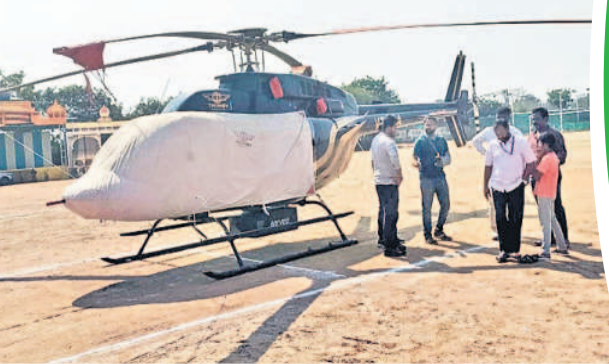
సాయిట్ గ్యాజెట్లలో మైదానంలో ల్యాండ్ అయిన డిజిటల్ భూ సర్వే హెలికాప్టర్

■ వర్షం వేట, తొర్రారు, నర్లంపేట, పరకాల తదితర పట్టణాల్లో ఏడివిన ■ హెలికాప్టర్లతో అధునిక తెలంగాణ అమల్లీ భూమి వివరాల సమోదయ కాజీపేట, ఫిబ్రవరి 9 : కేంద్ర ప్రభుత్వం చేపట్టిన ఏరియల్ భూ సర్వేలో భాగంగా సోమవారం వర్షంవేట, తొర్రారు, నర్లంపేట, పరకాల తదితర పట్టణాల్లో డిజిటల్ సర్వే చేయనున్నారు. 'నక్ష' పథకంలో ఎలాంటి ప్రజా కల లెని విన్న పట్టణాలను ఎంపిక చేసుకున్న కేంద్ర బృందం శాస్త్ర సాంకేతిక పరిజ్ఞానం కలిగిన కెమెరాలను అమర్చి హెలికాప్టర్ ద్వారా ఏరియల్ సర్వే చేస్తుంది. చిన్న పట్టణం, గ్రామాల్లోని చెరువులు, కాలులు, రోడ్లు, రైలు మార్గాలు, ప్లాట్లను విద్యుత్ వైర్లు తదితర అంశాలను సర్వే చేసి ఆక్షాంశాలు, రేఖాంశాలను సమోదయ చేయడంతో పాటు అన్ని ఫోటోలు, వీడియోలను తీసుకుంటుంది. ఈ సందర్భంగా సర్వే బృందం ప్రతినిధులు మాట్లాడుతూ ఆదివారం జగిత్యాల నుంచి హుస్సూబాద్ మీదుగా చిన్న పట్టణాలు, గ్రామాలను సర్వే చేశామన్నారు. సాయంత్రం కావడంతో