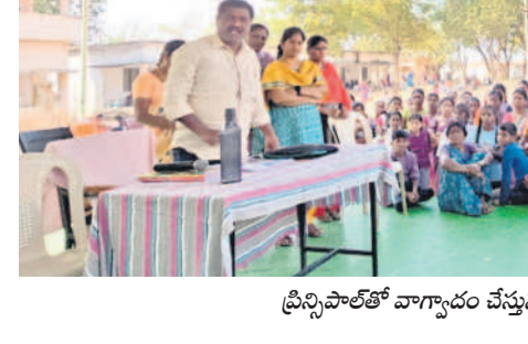
ప్రిన్సిపాల్ తో వాగ్వివాదం చేస్తున్న విద్యార్థినుల తల్లిదండ్రులు