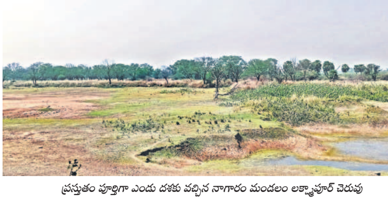
ప్రస్తుతం పూర్తిగా ఎందు దశకు వచ్చిన నాగారం మండలం లక్ష్మారావు చెరువు