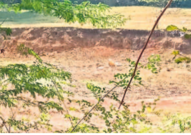
మక్కసీరు లేని అక్కడూర్, ఎస్ మండలం శ్రీధర్ గూడెంలోని వేపలచెరువు

సూర్యాపేట, ఫిబ్రవరి 9 (నమస్తే తెలంగాణ) : కాంగ్రెస్ ప్రభుత్వ నిర్ణయం, బాధ్యతారాహిత్యంతో రైతులకు ఇక్కట్లు తప్పడం లేదు. ప్రధానంగా చెరువులకు గత ఉమ్మడి రాష్ట్ర దుస్థితి దాపు రిస్తున్నది. నాడు మక్కసీరు లేక పండిపోగా బీజేపీ ఎస్ ప్రభుత్వం హయాంలో తెలంగాణ తొలి ముఖ్యమంత్రి కేసీఆర్ నిర్మించిన కాళేశ్వరం కాళేశ్వరం ఆయకట్టు కళకళలాడింది. చెరువులు ఏడాది అంతా నిండుగా ఉండి భూగర్భ జలాలు పెరిగాయి. కానీ మళ్ళీ నీటి కష్టాలు మొదలయ్యాయి. కాళేశ్వరం జలాలు రాక చెరువులు వట్టి పోయి పంటలు ఎండిపోతున్నాయి. ఈ స్థాయిలో నీటి సరికంటే వస్తుందని రైతులు కలలో కూడా ఊహించి ఉండరు. సూర్యాపేట జిల్లాలోని ఎస్సారెస్సీ ఆయకట్టు పరిధిలో 732 చెరువులు, కుంటలు 10శాతం కాళేశ్వరం ప్రాజెక్టు లేక ముందు 2014లో నీళ్లు లేక 85 శాతం చెరువులు ఖాళీగా దర్భనమైవు. కాళేశ్వరం ప్రాజెక్టు పూర్తయిన తర్వాత వంద శాతం చెరువులు జలకళకళతో పనిచేస్తున్నాయి. చిన్న సాకును చూపించి కాంగ్రెస్ ప్రభుత్వం కాళేశ్వరాన్ని పండ్లబెట్టడంతో ప్రస్తుత యాసంగి సీజన్లో చెరువులన్నీ ఖాళీగా దర్భనమవుతున్నాయి.