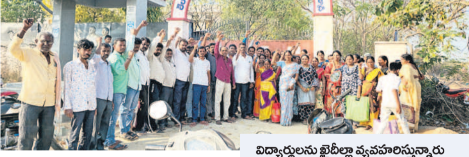
జనంపల్లి గురుకుల పాఠశాల ముందు ఆందోళన చేస్తున్న విద్యార్థినుల తల్లిదండ్రులు

రామన్నపేట, ఫిబ్రవరి 9 : పాఠశాలలో సమస్యలను పరిష్కరించాలని, విద్యార్థులకు ఇబ్బందులు లేకుండా చర్యలు తీసుకోవాలని డిమాండ్ చేస్తూ ఆదివారం రామన్నపేట మండలంలోని జనంపల్లిలో గల బాలికల గురుకుల పాఠశాలలో విద్యార్థులు తల్లిదండ్రులు ఆందోళన చేశారు. ప్రిన్సిపాల్ వైఖరిని నిరసిస్తూ దర్భా చేశారు. గురుకుల సాఫ్ట్ నిబంధనల ప్రకారం ప్రతినెలా రెండో ఆదివారం తల్లిదండ్రులకు తమ పిల్లలను కలిసి ఆవేశానం కలిగించారు. వివిధ ప్రాంతాల నుంచి తమ పిల్లలను కలిసేందుకు తల్లిదండ్రులు పాఠశాలకు వచ్చారు. దీంతో పాఠశాల సమస్యలు, విద్యార్థుల ఇబ్బందులను తెలిపేందుకు కొందరు తల్లిదండ్రులు ప్రిన్సిపాల్ రాజాను కలిగించి ఈ క్రమంలో విద్యార్థులు పడుతున్న ఇబ్బందుల గురించి ప్రిన్సిపాల్ కు తెలిపే సమయంలో వాగ్వివాదం జరిగింది. పాఠశాలలో నీటి కొరతతో అర్ధరాత్రి పానీయాలు చేయాలి వస్తుందని, బాతరూమ్స్ లో రేకులు లేక పోవడంతో కొడుకులు దాడులు చేస్తూ గాయ పరుస్తున్నాయని, తరగతి గదుల్లో ఫ్యాన్లు లేక పోవడంతో విద్యార్థులు ఇబ్బంది పడుతున్నారని తల్లిదండ్రులు వాపోయారు. బాత్ రూమ్ లో కంప్యూటర్ కొడుకుందన్నారు. నెలనెలా తల్లిదండ్రుల సమావేశం ఏర్పాటు చేయడం లేదని ఆరోపించారు. పిల్లల అనారోగ్యం పాలైతే పరిస్థితి ఏమి మింకే వరకు తమకు సమాచారం అందించడం లేదని ఆగ్రహం వ్యక్తం చేశారు. దానిపట్టి లేక పోవడంతో తరగతి గదుల్లోనే విద్యార్థులు పడుకోవాల్సి వస్తుందని ఆవేదన వ్యక్తం చేశారు. ప్రిన్సిపాల్, సిబ్బందికి ఫోన్ చేసిని స్పందించరని ఆరోపించారు. అనంతరం పాఠశాల ప్రధాన ద్వారం వద్ద ప్రిన్సిపాల్ అందుబాటులో ఉంటూ, నిరంతరం పర్యవేక్షిస్తూ నెల నెల