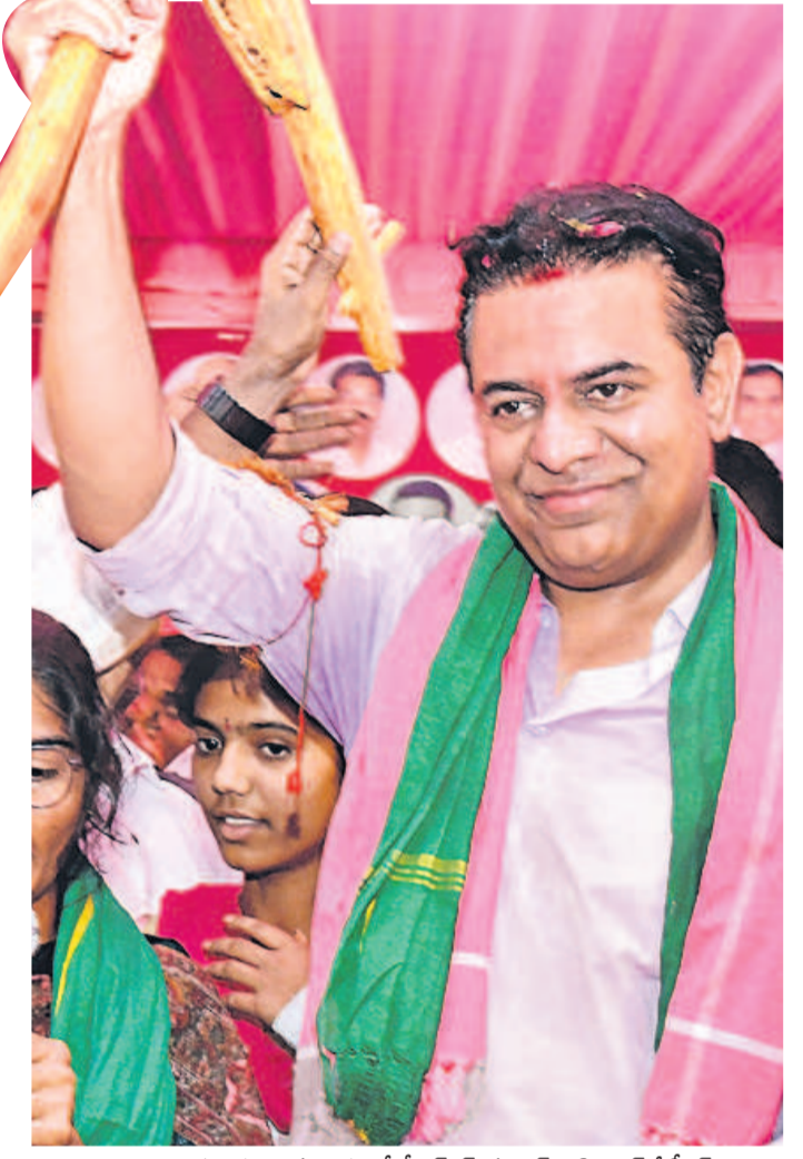
రైతులు బహూకరించిన నాగలితో బీఆర్ఎస్ వర్కర్ల ప్రిసిడెంట్ కేటీఆర్