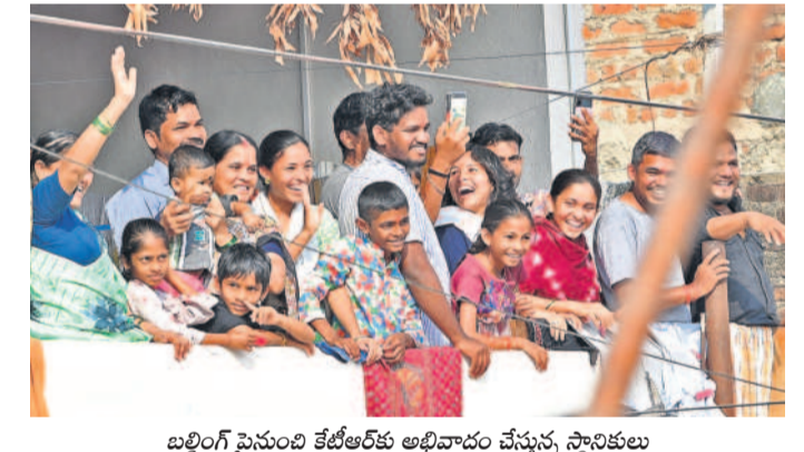
బల్లింగ్ పైనుంచి కేటీఆర్ కు అభివాదం చేస్తున్న స్థానికులు