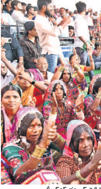
బీఆర్ఎస్ వర్కర్ల ప్రిసిడెంట్ కేటీఆర్ ప్రసంగిస్తుండగా గిరిజన మహిళల కరతాక్షరాలు

సాక్షిలో మాట్లాడుతూ 'రేపంకేరెడ్డి రైతులండు వేస్తాడు.. ఫిబ్రవరి 31లోపు అన్నం.. ఇట్టుంటి ఆయన తీరు' అని ఎద్దేవాచేశారు.