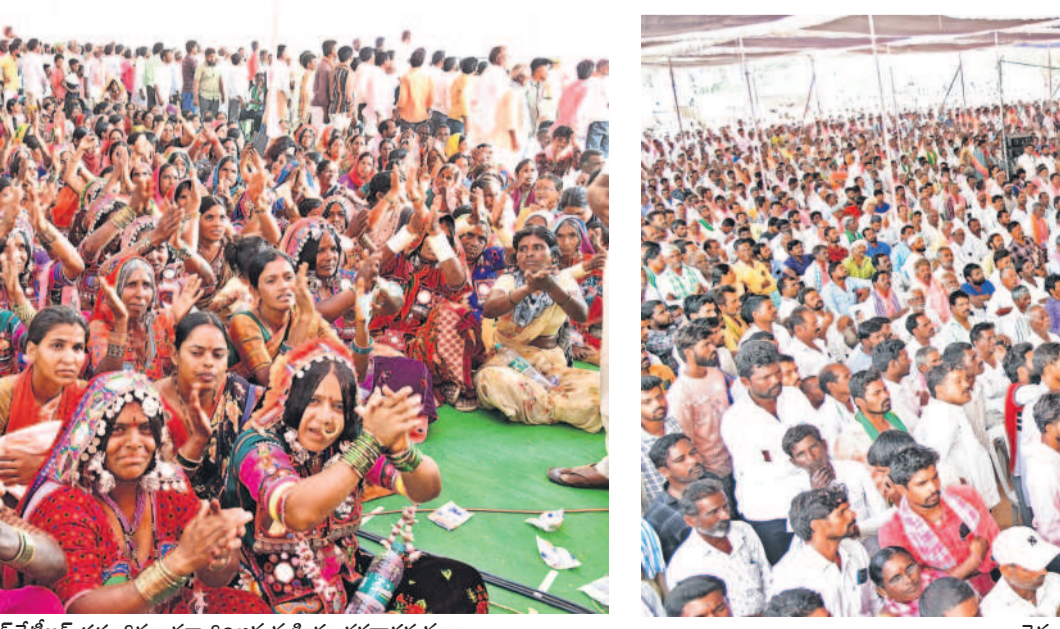
రైతు నిరసన దీక్షకు భారీగా తరలివచ్చిన రైతులు, బీఆర్ఎస్ కార్యకర్తలు