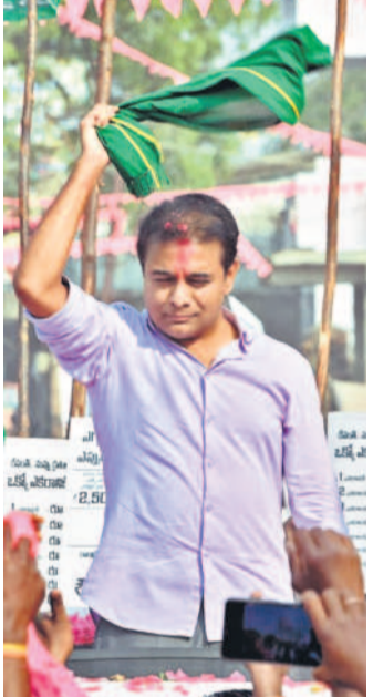
ఒక్క ఓటు తక్కువైనా రాజకీయ సన్యాసం

'రేపంకేరెడ్డిని నేను దుర్యోధనుడు అని ఉత్తగ అనలే.. పాండువులను ఊళ్ళల్లో ఉండ నీయకుండా ఆడవికి పంపిండు.. అట్టినే రేపంకే కూడా మా ఆడబిడ్డలను తండ్లాడో ఉండనీయకుండా ఆర్డర్ తాత తండాలో పంపిండు.. వాళ్ళ తలుపులు జరగజేస్తే.. ఆ దోస్తీను అవమానించి పుట్టకొకలు.. చెట్టు కొకలు అన్నట్టు జంగల్ పొంట ఉరికిచ్చిం దు. అందుకే రేపంకేరెడ్డి దుర్యోధనుడు అంటున్నా' అని కేటీఆర్ దుయ్యబట్టారు. 'భూములు కోల్పోతున్న గిరిజనలకు అందగా నిలబడ్డం.. వాళ్ళను ఢిల్లీ దాకా భూములు పోకుండా పూర్వాయ కమిషన్ ముందు చెప్పినం.. 40 రోజుల