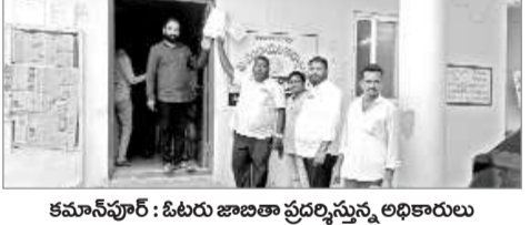
కమాన్ పూర్ : ఓటరు జాబితా ప్రదర్శన, అధికారులు