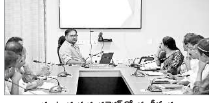
మాట్లాడుతున్న, కలెక్టర్ కోరుకుంటున్న

పెద్దపల్లి, ఫిబ్రవరి 10: జిల్లాలో పీఎం శ్రీ (ప్రధాన మంత్రి స్మార్ట్ పర్ రైసింగ్ ఇండియా) కింద ఎంపీజెఎస్ పాఠశాలల్లో నిర్దేశిత అభివృద్ధి పనులను ఈనెలాఖరులోగా పూర్తి చేయాలని జిల్లా కలెక్టర్ కోరుకుంటున్నట్లు అధికారులు సోమవారం కలెక్టరేట్లో పీఎం శ్రీ పాఠశాలలపై సంబంధిత అధికారులు, పాఠశాలల ప్రధానోపాధ్యాయులతో సమీక్ష సమావేశం నిర్వహించారు. జిల్లాలో ప్రధాన మంత్రి స్మార్ట్ పర్ రైసింగ్ ఇండియా పీఎం శ్రీ కింద 2 విడుదలలో 16 పాఠశాలలను ఎంపీజెఎస్ పాఠశాలలుగా మార్చారు. వీటిలో నిర్దేశిత మొదటి దశ అభివృద్ధి పనులను నిర్దేశిత గడువులో పూర్తి చేయాలని అధికారులు అభ్యర్థించారు. వచ్చే నెలలో జరిగే పదో తరగతి పరీక్షల్లో మెరుగైన ఫలితాలు సాధించడమే లక్ష్యంగా కార్యదర్శులు అనుకుంటున్నట్లు అధికారులు, తదితరులు పాల్గొన్నారు. భూగర్భ జలాల నాణ్యత నివేదిక అందించాలి భూగర్భ జలాల నాణ్యతను పరీక్షించి నివేదిక అందించాలని కలెక్టర్ కోరుకుంటున్నట్లు అధికారులు అభ్యర్థించారు. సోమవారం కలెక్టరేట్లో సంచార నీటి నాణ్యత ప్రయోగశాల వాహనాన్ని కలెక్టర్ పరీక్షించారు. నేషనల్ హైడ్రాలజీ ప్రాజెక్టు కింద భూగర్భ జలాల నాణ్యత పరీక్షణ కోసం ఏర్పాటు చేసిన సంచార నాణ్యత ప్రయోగశాల (మొబైల్ క్వాలిటీ ల్యాబ్ ఆన్ వీల్స్)ను సమర్పంచగా వినియోగించుకోని నీటి నాణ్యత ప్రజలకు అవగాహన కల్పించాలి అధికారులు అభ్యర్థించారు. రామగండం పరిసర ప్రాంతాలు, ఎన్నారెస్ ఆయకట్టు ప్రాంతంలో భూగర్భ జలాల నాణ్యత అధ్యయనం చేసి