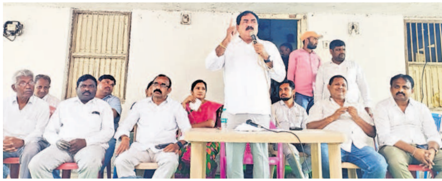
మాట్లాడుతున్న మాజీ మంత్రి ఎర్రబెల్లి దయాకర్ రావు