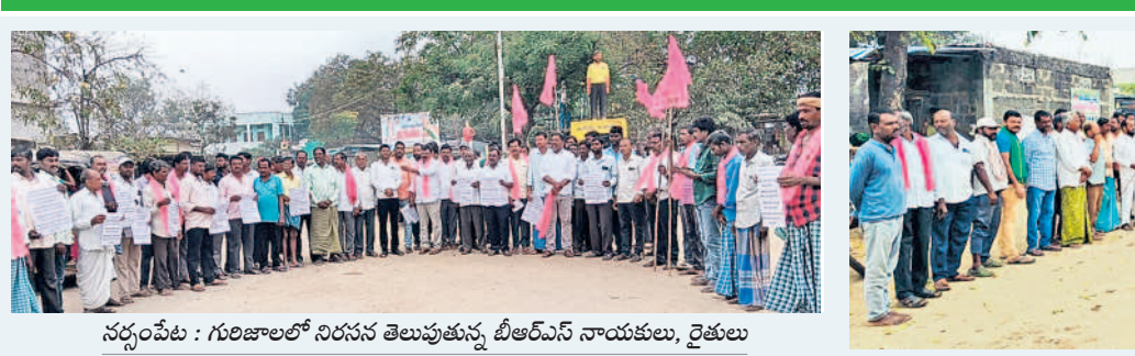
నర్సంపేట : గురిజాలలో నిరసన తెలుపుతున్న బీఆర్ఎస్ నాయకులు, రైతులు