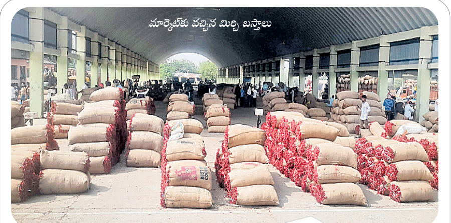
మార్కెట్ వచ్చిన మర్చి బస్తాలు

వరకాల ఏడాదికి రూ. 15 వేలు వేస్తామని మాట తప్పారని, ఇప్పుడు ఎకరానికి రూ. 6 వేలు రైతు భాతాల్లో జమవుతున్నారని, సెల్ ఫోనులకు లింగ్ లింగ్ మని మెన్సిజేలు వస్తాయన్నారు, అవేమీ లేవన్నారు. అలాగే రైతు రుణమాఫీ 30 శాతం కూడా చేయలేదన్నారు. అలాగే రైతు రుణమాఫీ 30 శాతం కూడా చేయలేదన్నారు. అలాగే రైతు రుణమాఫీ 30 శాతం కూడా చేయలేదన్నారు. అలాగే రైతు రుణమాఫీ 30 శాతం కూడా చేయలేదన్నారు. అలాగే రైతు రుణమాఫీ 30 శాతం కూడా చేయలేదన్నారు.