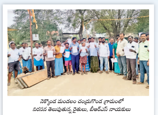
నేకొండ మండల చంద్రగిరి గ్రామంలో నిరసన తెలుపుతున్న రైతులు, బీఆర్ఎస్ నాయకులు