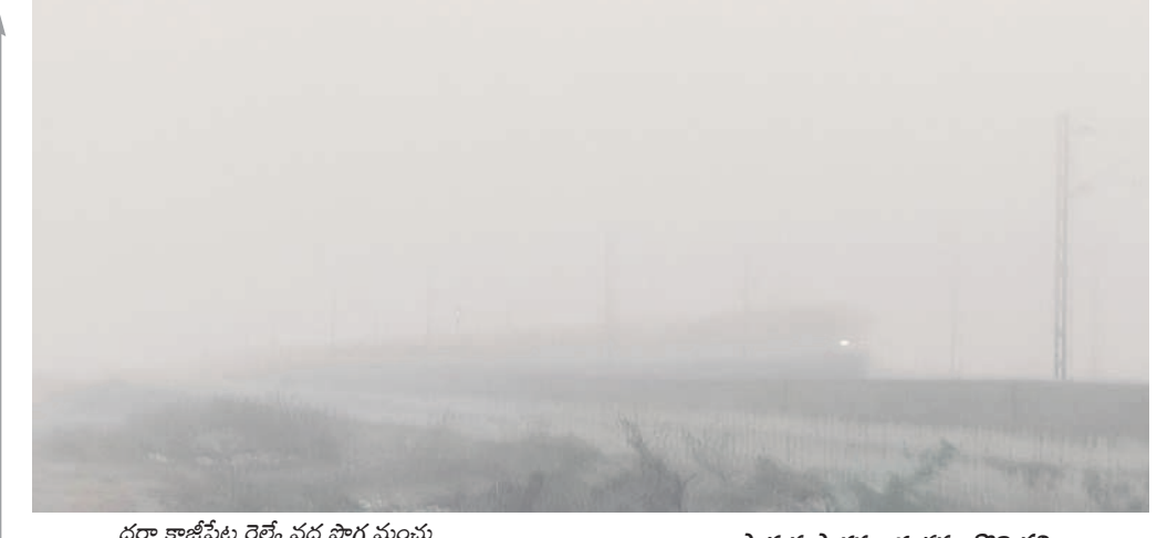
దర్గా కాజీపేట రైల్వే వద్ద పొగ మంచు

పొద్దున పొగమంచు కమ్ముకొని చలి చంపిస్తుంటే మధ్యాహ్నం అయ్యేసరికి అందరినీ చాలాతోంది. కొద్దిరోజులుగా ఇలా భస్మమైన వాతావరణం కనిపిస్తోంది. సోమవారం పొద్దింకొని చలి ప్రభావం అలాగే ఉంది. చాలాచోట్ల 10 గంటల వరకు సూర్యుడు బయటకు రాలేదు. దీంతో వాహనదారులు లైట్లు వేసుకుంటూ నెమ్మదిగా ప్రయాణించాల్సి వచ్చింది.