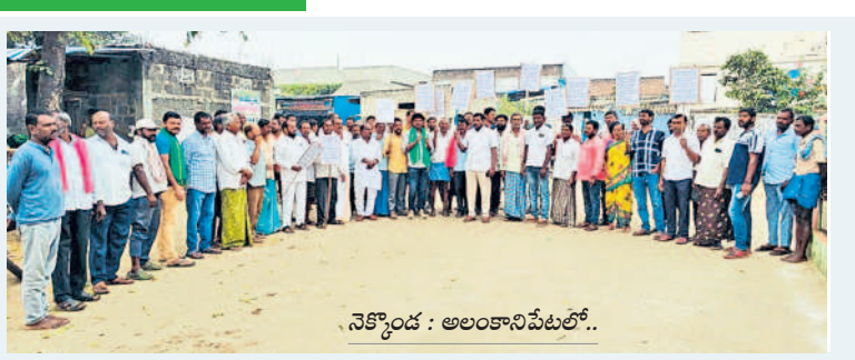
నేకొండ : అలంకానిపేటలో..