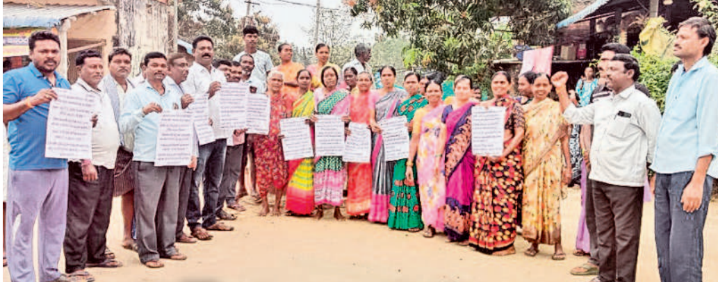
వెన్నారావుపేట మండల కేంద్రంలో నిరసన తెలుపుతున్న రైతులు, బీఆర్ఎస్ నాయకులు