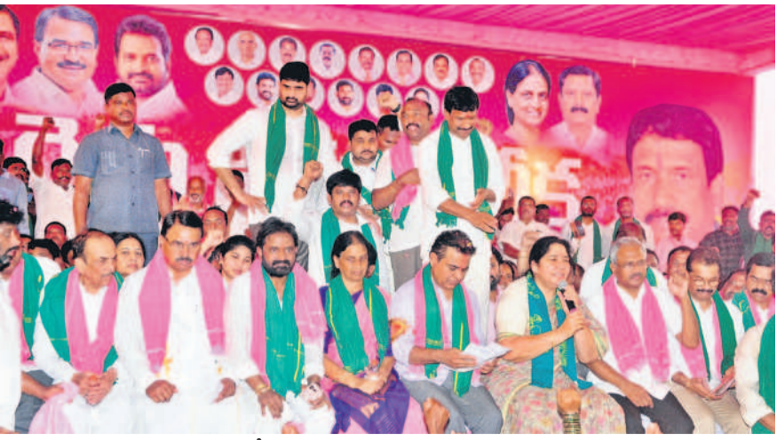
రైతు నిరసన దీక్షకు హాజరైన కేటీఆర్, మాజీ మంత్రులు, మాజీ ఎమ్మెల్యేలు, నాయకులు

రేపంత్ రోడ్డు విస్తరణకు అడ్డంగా ఉన్న ఇండ్లను హిటాబిట్ కూల్చివేయిస్తున్న అధికారులు మద్యం, ఫిబ్రవరి 10 : కాంగ్రెస్ ప్రభుత్వంలో జూరుకు కూల్చివేతల భయం పట్టుకున్నది. ప్రజా సంక్షేమానికి పాటు పడుతామని చెప్పి అధికారంలోకి వచ్చిన ప్రజాపాలన ఇలాకాలో కూల్చివేతలు కొనసాగాయి. నారాయణపేట జిల్లా మద్యం మండలం రేపంత్ రోడ్డుకు అడ్డంగా ఉన్నాయని కొన్ని ఇండ్లను అధికారులు కూల్చివేశారు. రేపంత్ రోని దర్గా నుంచి ఎన్నో కాలనీ మీదుగా మోమినాపూర్ కు వెళ్ళే 16 ఫీట్ సీసీ రోడ్డును 27 ఫీట్లకు విస్తరించే పనుల్లో భాగంగా 8 ఇండ్లను జేసీబిట్ కూల్చివేశారు. సుమారు 500 మీటర్ల వరకు నిర్మాణాలు కూల్చివేశారు. నోటీసులు ఇవ్వకుండా.. ముందస్తు సమాచారం లేకుండా ఒక్కసారిగా ఆరే అండేబి అధికారులు హిటాబిట్ గ్రామానికి చేరుకొన్నారు. రోడ్డు విస్తరణలో భాగంగా అడ్డంగా ఉన్న నిర్మాణాలను కూల్చివేసేందుకు వచ్చారు. దీంతో స్థానికులు అడ్డుకోవడంతో గ్రామంలో ఉద్రిక్తత ఏర్పడింది. నష్ట పరిహారం ఇవ్వకుండా అడ్డంగా కూల్చివేసే అని అని నిలదీశారు. అందులో ఇకరే పార్టీ నేతలు, పెదల ఇండ్లను కూల్చడం ఏమిటని ఆగ్రహం వ్యక్తం చేశారు. రోడ్డు విస్తరణపడం మంచిదే.. అందరికీ రవాణా సౌకర్యం బాగుంటుంది.. కానీ ముందస్తు సమాచారం ఇవ్వకుండా కూల్చివేతలు ఎలా చేస్తారని మండి