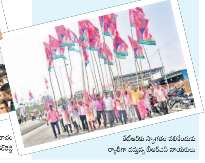
కేటీఆర్ కు స్వాగతం పలికేందుకు వేస్తున్న కేటీఆర్, పట్టు సరేదర్ రెవెన్యూ