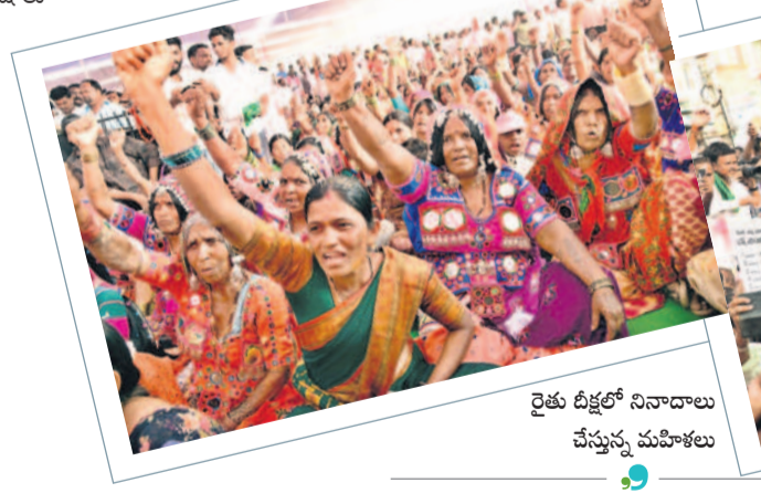
రైతు దీక్షలో నిరాదాని చేస్తున్న మహిళలు

మహబూబ్ నగర్, ఫిబ్రవరి 10 (నమస్తే తెలంగాణ ప్రతినది) / మద్యం: సీఎం రేపంత్ రెవెన్యూ సాచి నియోజకవర్గంలో గులాబీ దళం కదం తొక్కింది. కాంగ్రెస్ పార్టీ ఇచ్చిన హామీలు అమలు చేయాలని డిమాండ్ చేస్తూ సోమవారం ఏర్పాటు చేసిన రైతు నిరసన దీక్ష కనీవని ఎరుగని రీతిలో 'సక్సెస్ అయింది. ఈ రైతు నిరసన దీక్షను భగ్నం చేయాలని కాంగ్రెస్ నాయకులు పన్నిన కుట్రలను ఛేదించుకుంటూ భారీ అక్షయ రైతులు తలదాచుకున్నారు. కేటీఆర్ సభకు వెళ్ళడంకూడా చాలా గ్రామాల్లో కాంగ్రెస్ నాయకులు పాల్గొంటే సంబంధం లేకుండా కార్యక్రమాలకు విందు భోజనాలు ఏర్పాటు చేశారు. బెనెన్, మునీన్ బిర్లాలు పెట్టిన అక్కడ తిని కేటీఆర్ సభకు రావడంతో కంగుతిన్నారు. బీఆర్ఎస్ రైతు మహాధర్మా సక్సెస్ పుల్ కావడంతో కాంగ్రెస్ పార్టీలో గుబులు రీతం. సీఎం రేపంత్ రెవెన్యూ, ఆయన కుటుంబ సంభ్యుల అరాచకాలను కేటీఆర్ దుమ్మెత్తి పోశారు. కొడంగల్ జనంపై ప్రేమ లేదని.. కేవలం ఆయన అల్లుడికి, అదానికి, అదానికి సంభ్యులకు డోబి పెట్టడంకే గిరిజనుల భూములను లాక్కుంటున్నారని మండిపడ్డారు. కేటీఆర్ ప్రసంగిస్తున్నంత సేపు జనం కదలలేదని గమనించారు. మధ్యాహ్నం 2 గంటలకు రైతు దీక్ష ప్రారంభమవుతుందని చెప్పినప్పటికీ 12 గంటలకే రైతులు, మహిళలు పెద్దపత్తున సభా ప్రాంగణానికి తరలివచ్చారు. ఒంటి గంటకే సభా ప్రాంగణ మొత్తం నిండిపోయింది. మరోవైపు కేటీఆర్ రాజకీయం కోసం పట్టణ శివారులో వేలాదిమంది రైతులు ఎదురు చూస్తున్నారు. సరిగ్గా మధ్యాహ్నం 3 గంటలకే కేటీఆర్ లగవర్ష రైతులకు హాకీపేటలో సందేహావం ప్రకటించారు. అక్కడ నుంచి మొదలైన కేటీఆర్ ర్యాలీ సభకు వచ్చేవరకు 45 నిమిషాలు పాటు