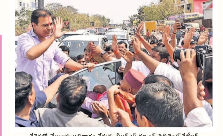
చేవెళ్లలో శ్రేణులకు అభివాదం చేస్తున్న బీఆర్ఎస్ వర్కింగ్ ప్రైసిడెంట్ కేటీఆర్