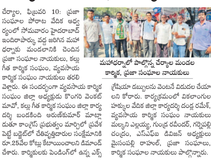
మహాభద్రాల్లో పాల్గొన్న చేర్యాల మండల కార్యక్, ప్రజా సంఘాల నాయకులు