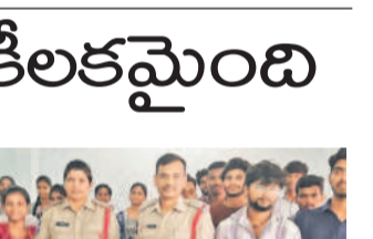
నిరదిస్తున్న సంఘం నాయకులు