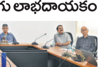
చట్టాలపై విద్యార్థులకు అవగాహన కలిగిస్తున్న సీబి

సిద్దిపేట టౌన్, ఫిబ్రవరి 10: విద్యార్థి దశ కీలకమైందని, విద్యార్థులు చదువుకు మొదటి ప్రాధాన్యత ఇవ్వాలని సిద్దిపేట టౌన్ సీబి ఉపాధ్యక్షుడు మున్సిపల్ కమిషనర్ సూచించారు. బీఎంఆర్ డిగ్రీ కళాశాలలో సోమవారం చట్టాలపై విద్యార్థులకు అవగాహన కలిగిస్తున్న సీబి