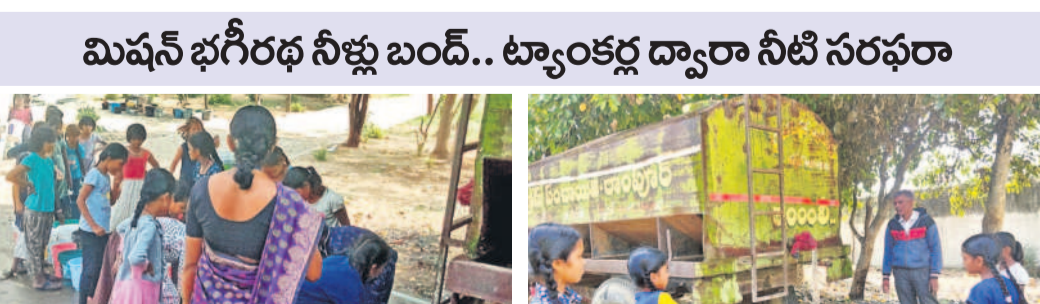
మిషన్ భగీరథ నీళ్లు బండ్.. ట్యాంకర్ల ద్వారా నీటి సరఫరా