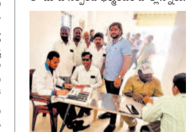
రోగిలకు పరీక్షలు చేస్తున్న వైద్యులు