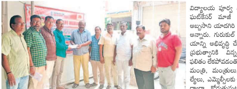
ఘటికేసర్ పోస్టాఫీసు వద్ద సీమంత్ ఉత్తరాల పోస్టు చేస్తున్న పూర్వ విద్యార్థులు

ఘటికేసర్, ఫిబ్రవరి 11: గురుకుల్ విద్యాలయానికి పూర్వ వైభవం వచ్చేలా, ప్రభుత్వం దిగివచ్చే వరకు ఉత్తరాల ఉద్యమాన్ని మరింత ఉధృతం చేస్తామని గురుకుల్