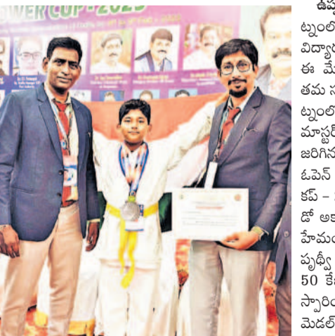
ఉప్పల్ ఫిబ్రవరి 11: విశాఖ లుల్లూర్ జరిగిన కరాటే పోటీల్లో విద్యార్థులు ప్రతిభను చాటారు.