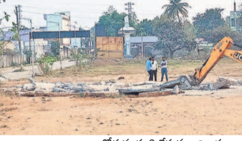
రోడ్డును మాల్చిచేస్తున్న అధికారులు

మేడ్చల్, ఫిబ్రవరి 11: మేడ్చల్ మున్సిపాలిటీ అడ్మినిస్ట్రేషన్ పరిశోధన అలయం పక్కన ఉన్న శిఖం భూమిలో నుంచి వెనకటం ప్రయోజనం చేకూర్చేలా వేసిన సీసీ రోడ్డును రెవెన్యూ శాఖ అధికారులు మంగళవారం కూల్చివేశారు.