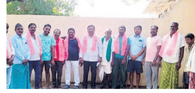
బొమ్మకల్లులో సమన్వయ సమావేశంలో పాల్గొన్న బీఆర్ఎస్ నేతలు