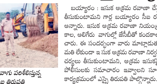
ఇసుక నియంత్రణ చర్యల్లో వాగు పరిశీలిస్తున్న సీబి రవికుమార్, ఎంపీ తిరుపతి

బయ్యారం : ఇసుక అక్రమ రవాణా చేస్తే చర్యలు తీసుకుంటామని గాడ్ బయ్యారం సీబి రవికుమార్ అన్నారు. ఇసుక అక్రమ రవాణా నియంత్రణకు పాళాల, అలిగేరు వాగుల్లో జీసీబీతో కలకండా తీయించారు. ఈ సందర్భంగా వారు మాట్లాడుతూ.. అనుమతి లేకుండా ఇసుక అక్రమ రవాణా నిర్వహిస్తే కలిసే చర్యలు తీసుకుంటామని, ఇవ్వాలి ఇసుకపై ప్రజలు పోలీసులకు సమాచారం అక్కరలేని సమాచారం. కార్యక్రమంలో ఎన్నె తిరుపతి పాల్గొన్నారు.