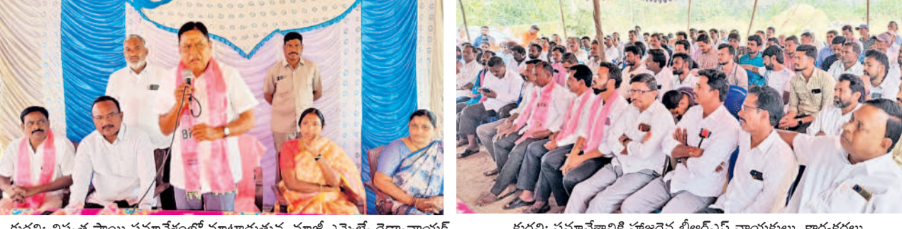
కురవి: విద్యుత్ స్థాయి సమావేశంలో మాట్లాడుతున్న మాజీ ఎమ్మెల్యే రెడ్డానాయక్