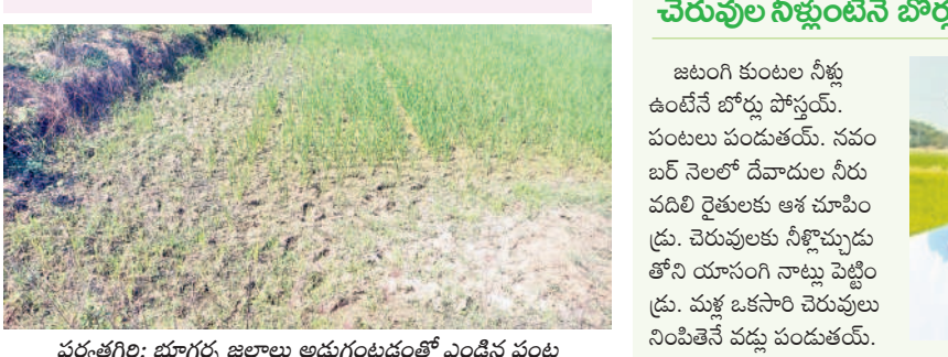
వర్షానికి భూగర్భ జలాలు అడుగుంటుంటే ఎండిన పంట

గత కేసీఆర్ ప్రభుత్వ హయాంలో కాల్యూల తవ్వకం ద్వారా జలాలు విడుదల చేయడంతో మండు చేసిన బోరును చెరువులు, కుంటలు మళ్లీ కుండా చేశారు. వారుపై నిర్మించిన చెక్కెండ్లలో ఏడాదంతా పుష్పలంగా నీరుండేది. ఫలితంగా భూగర్భ జలాలు పెరిగి బావులు, బోరు నీటిలో కళకళలాడేవి. దీంతో భూములన్నీ చచ్చి పోయాయి. బోరు నీటిలో కళకళలాడేవి. దీంతో భూములన్నీ చచ్చి పోయాయి. బోరు నీటిలో కళకళలాడేవి. దీంతో భూములన్నీ చచ్చి పోయాయి.