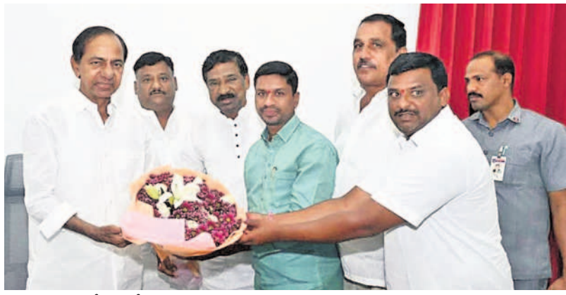
మాజీ సీఎం కేసీఆర్ కు పుష్పగర్వం ఇస్తున్న స్టేషన్ ఘనపూర్ మాజీ ఎమ్మెల్యే రాజయ్య, మాజీ జడ్పీటీసీ కీర్తి వెంకటేశ్వర్లు, సీనియర్ నాయకుడు మల్లికార్జున్ రాజేశ్వర్లతో ఆదిత్యులు