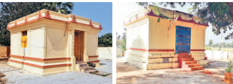
మిసీ జాతరకు సిద్ధమైన మేడారంలోని సమృద్ధి పూజా మందిరం, కన్నెపల్లిలోని సారలమ్మ పూజా మందిరం