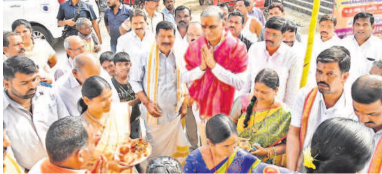
హారీరావుకు స్వాగతం పలుకుతున్న అధ్యక్షులు, నిర్వాహకులు