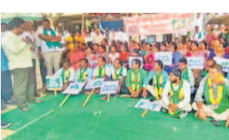
సంగారెడ్డి జిల్లా గుమ్మడిదలలో ప్రారంభించిన లలి నిరాహారదీక్ష

● డంపింగ్ యార్డుకు వ్యతిరేకంగా పాడిపంపులతో ఎన్ హెచ్ డి అందోకన