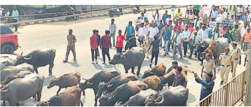
డంపింగ్ యార్డుకు వ్యతిరేకంగా సంగారెడ్డి జిల్లా గుమ్మడిదలలో పాడిపంపులతో ఎన్ హెచ్ డి విస్తారంగా నిరసన వ్యక్తం చేస్తున్న రైతు జేపీసీ నాయకులు