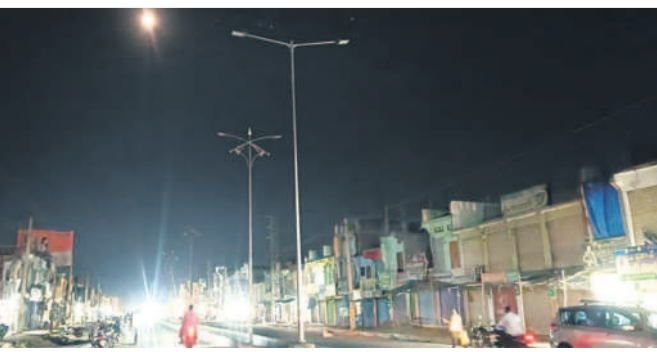
చున్నాబాద్ పట్టణం ప్రధాన రహదారిపై వెలుగని విద్యుత్ దీపాలు

చున్నాబాద్ టౌన్, ఫిబ్రవరి 11: చున్నాబాద్ పట్టణంలో ప్రధాన రహదారిపై నెలరోజులుగా విద్యుత్ సరఫరా వెలుగడలేదు. విద్యుత్ కోతలోనే పాదచారులు, వాహనదారులు వెళ్లాలిని దుస్థితి. ఇది నియోజకవర్గ కేంద్రమైన చున్నాబాద్ పట్టణంలోని పరిస్థితి. జాతీయ రహదారి అభివృద్ధిలో భాగంగా సెంట్రల్ లైటింగ్ సిస్టం పనిచేయకపోవడంతో చున్నాబాద్ పట్టణంలోని సిద్దిపేట, హన్మకొండ రోడ్లకు కలిపి ప్రధాన రహదారిపై బిక్కుబిక్కు అయిపోయాయి. దీంతో రాత్రింజా బిక్కుబిక్కు ప్రయాణం సాగించాలిని పరిస్థితి నెలకొంది. రోడ్డుమధ్యలోనే డివైర్ల నడుమ ఏర్పాటుచేసిన సికాకోకలకు విద్యుత్ తీవ్రతలు అరిపోయి నెలరోజులు గడుస్తున్నాయి. వాటిని పునరుద్ధరించే విషయం ఎవరికీ పట్టడం లేదు. సరఫరా వెలుగడలేదు. విద్యుత్ సరఫరా పునరుద్ధరించే విషయంలో మున్సిపాలిటీ అధికారులు విఫలమయ్యారనే విషయం వ్యక్తంపడుతున్నాయి. మంత్రి పాస్పం ప్రభాకర్ చౌరక తీసుకుని విద్యుత్ సరఫరా వెలిగే వరకు తీసుకోవాలని పట్టణ ప్రజలు కోరుతున్నారు.